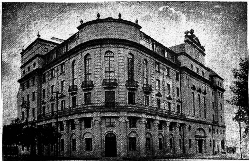
Poola raudteelaste ühingu Z. Z. K. kodu Varssavis.

Krakovil on 1000 aastane minevik seljataga. XI sajandist alates ja kuni XVI sajandi lõpuni oli Krakov poola kuningate residentsiks. Loomulik, et selle tõttu Krakov kujunes Poola poliitilise, majanduslise ja vaimlise elu keskkohaks. Olukord muidugi muutus residentsi üleviimisega Varssavi, kuid poliitiliste sündmuste tõttu XIX sajandil Krakov muutus jälle Poola vaimse elu keskkohaks. Ei ole siis ka ime, et Krakovis peaaegu iga maja, iga mälestussammas on täikk Poola ajalugu. Täie õigusega hüütakse Krakovit põhja Roomaks. Loss ühes katedraliga on Poola rahva elav ajalooline dokument. Siin on Poola rahva ajalugu jäädvustatud puus, kivis ja marmoris. Lossi üle on mitmed kurjad tuuled puhunud. Teda on mongoolid ja teised vaenlased püüdnud hävitada ja Austria keisrivalitsus kasarmuks muuta, kuid ta on siiski oma ajaloolise ilme säilitanud ja kui ehitusmonument mõjub valdavalt.