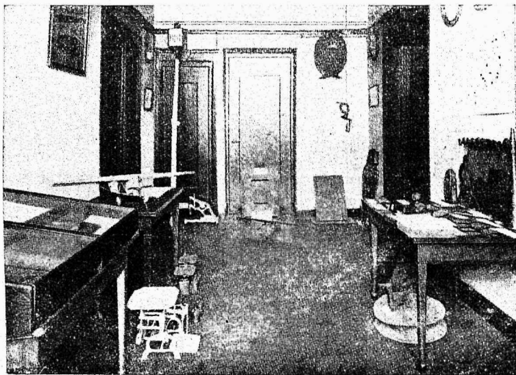
Osake ajaloolisest osakonnast.