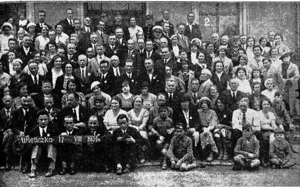
(soolakaevanduse kontori ees).

terve sületäie lillekimpudega iga vaguni jaoks. Varssavi jõudis 20. VIII kell 8 hommikul. Jaamas võtsid meid vastu Varssavi kolleegid ja viisid hommikueinele raudteelaste majja. Pärast käidi loomaaias, raudtee muuseumis ja füüsilise kasvatuse instituudis. Raudtee muuseum, mis asub Kerbedzia silla lähedal — Nowy Zjazd nr. 1 — on väga vaatamisvääriline. Siin on Poola raudtee ajalugu ja tegevus esitatud igasuguste statistiliste andmete ja graafikutega, samuti tehniline külg mudelite näol. Muuseum võtab enda alla umbes 20 tuba ja välja panevate arv ulatab umbes 2.000-ni. Muuseumi juhib ins. I. Wolkanowski. Aramärkimist väärib veel füüsilise kasvatuse instituut. See on hiiglaehitus ja maksab 12 miljonit zlotti (8,4 miljonit Eesti krooni). Siin saavad põhjaliku ettevalmistuse kehalise kasvatuse instruktorid. Instituuti võetakse keskkoolilõpetanud mõlemast soost. Kursus kestab 2 aastat. Õppemaksu suurus ühes täieliku ülevalpidamisega internaadis on 125 zlotti (87,5 kr. kuus). Instituudis pidi õppima ka üks eestlane.