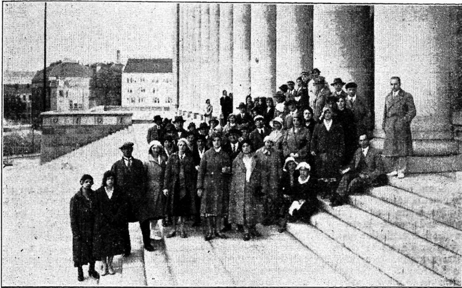
Soome uue parlamendihoone ees.

Kell pool kümme asusime teele Viiburi (Viipuri) poole. Soome raudteede peadirektori lahkelt vastutulekul anti meile reisiks teise klassi vagunid, kusjuures kahetsust avaldati, et ei olnud võimalik magamisvaguneid anda. Sõit kestis öö läbi. Viiburis võttis meid vastu ametnikkude ühingu kohaliku osakonna juhatus. Hommikueinena oli jaama puhvetis piim ja kohvi võileibadega valmis pandud. Jaamaülema asetäitja tutvustas meid jaamahoonega, mis enesest kujutab suurt huvitavat hoonet. Ehitatud 1912. aastal