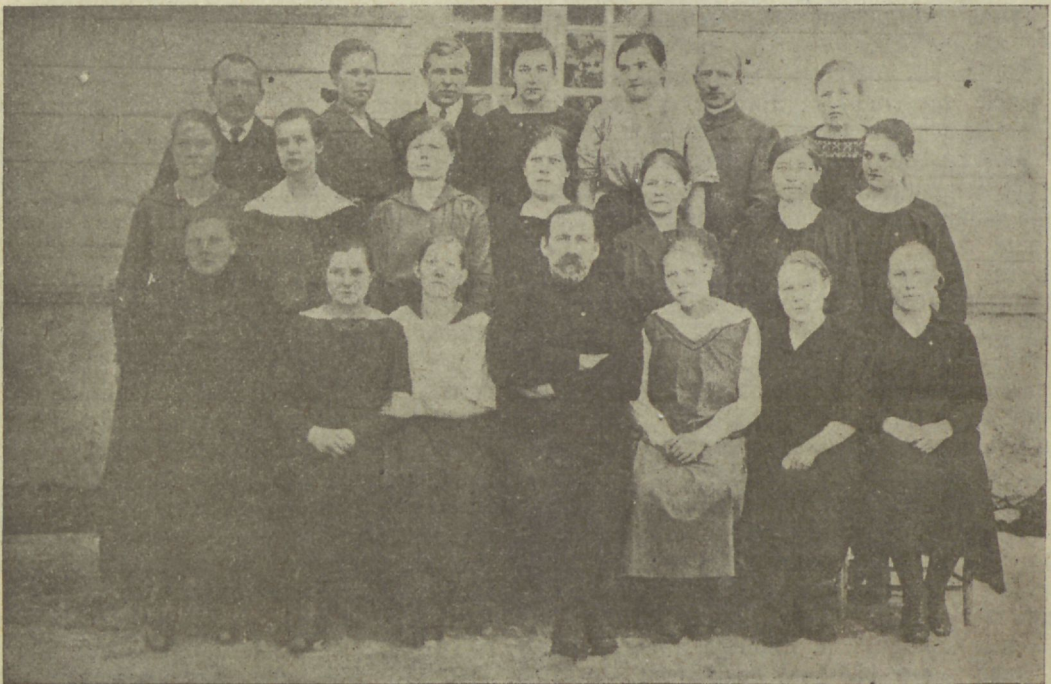
Rärdla C. E. Ühing.

2) Tihti on ärataganemise põhjuseks üleliigne töö ilmalikes asjus. Kui sul nii palju ilmlikke toimetusi on, et kõik su mõtted sellega on täidetud ja kõik aeg selle peale kaob, pead sa tingimata ära langema. Sul ei ole õigust niipalju tööd teha, et palweks aega üle ei jää. Seda ei ole tarwis. Jumal ei nõua seda. Sa ei soowi mitte, et Tema sulased tööga nii oleks koormatud, et aega ei ole Temaga nõu pidada, Temale oma olekust ja toimetustest aru anda ja tema juhatusst paluda. Sul ei ole wististi õiget waadet töö peale, kui sul teda nii palju kokku kogub, et wõimatu on Jumalat teenida.