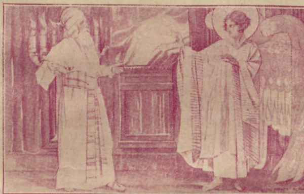
Jõulusündmuse ettevalmistus. Ingel ilmutab Sakariale.

Ta fündab oma perekonna kõigest maailmast foktu tuua. Jgailks tõttab täis rõõmu koju poole. Milline