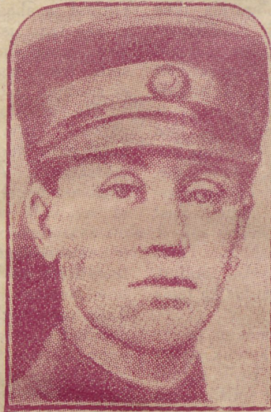
Marshal Tschiang Kaischek,

Imelik on õhtul magama heita ja rahu on hinges, hommikul üles tõusta ja rahu on hinges, oma igapäevast halli tööd teha, kui rahu on hinges, kui on ära võetud mässav, nutja süda, ja antud uus — täis rahu ja vaikust . . .