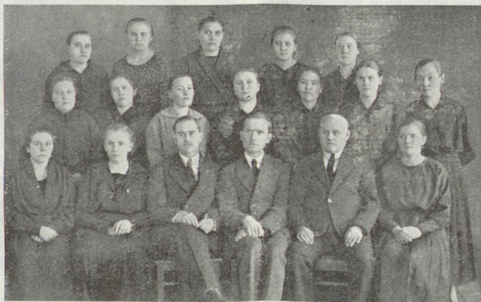
Noarootsi C. E. Ühingu haapsalu osakond.

9. Meie peame Jumala sõna meeles pidama ja südamele mõjuda lastma. Ta hoiab meid patu (laul 114 : 11) ja eksiõpetuse eest (Ap. teg. 20 : 29, 30 : 32. 2. Tiim. 3 : 13—15), täidab meie südamed rõõmuga (Jer. 15 : 16) ja rahuga (laul 85 : 8). Ta annab meile wõidu kurja üle (1. Joh. 2 : 15); annab meile wäge palwe tarwis (1. Joh. 15 : 7); teeb meid targemaks kui wanad ja kõik meie waenlased (laul 1 : 19, 98, 100, 130); teeb meid täiesti kõlblikkudeks, kes kõigele heale tööle täiesti on walmistatud (2. Tim. 3 : 16 ja 17). Tee proowi. Murekse omale laia äärega piibel, kus sul ruumi on märkusi teha ja paralleelsed kohad juurde kirjutada. Tarwita uurimise juures alati seda piiblit; pea saab ta sulle tingimata tarwilikuks asjaks ja lahtiseks warakambriks, kust iga päew uusi kallistuse wälja toob. (Jes. 45 : 3).