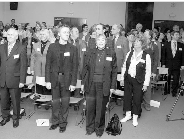
Head kodanikud harjutavad sirge seljaga seismist.

on kohtuda inimesega, kes on sirge seljaga ja hirmutu. Aga meie sisemine häälestatus on aastakümnete jooksul ja ilmselt osalt rohketest okupatsioonidest johtuvalt läinud alla. Nagu koorilaul – kui dirigent aktiivselt ei tegutse, me vajume helistikus. Nii on ka meie rühiga, hoiakuga teiste suhtes. Me oleme enda meelest sirged, aga tegelikult kõverad.