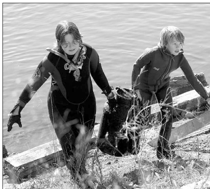
Sukeldujad ja vabatahtlikud linnakodanikud puhastavad Pae karjääri.

Seega, hea kodanik peaks olema hooliv, tark ja tegus ühiskonna hoidja. See võiks olla üks pidepunkt, millele järgneva kahe aasta jooksul mõelda.