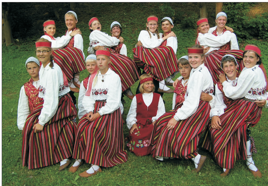
Vargamäe Noored tantsupeol "Maa ja ilm".