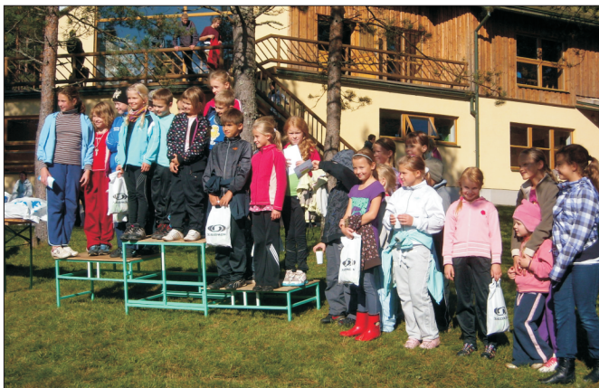
Maastikumängu kolm paremat võistkonda.

Valgehobusemäe suusa- ja puhkekeskuse projektijuht