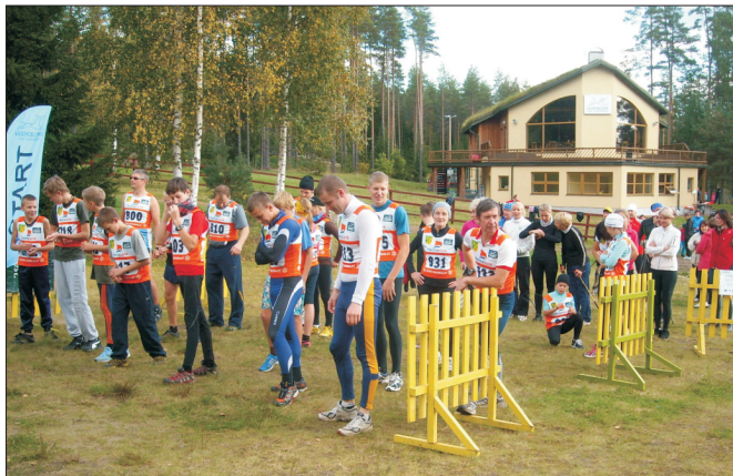
8 kilomeetri jooksjad stardis.

Pikemate jooksudistantside jaoks olid korraldajad Valge-