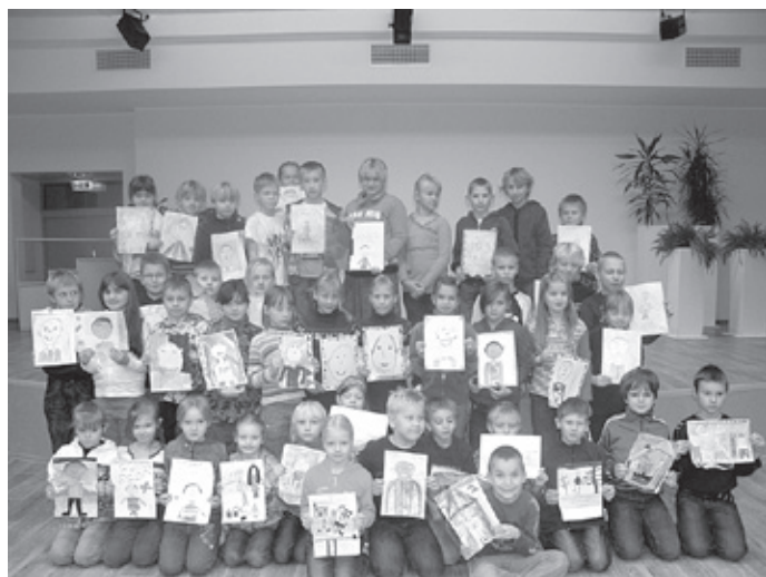
Raamat „Minu isa“