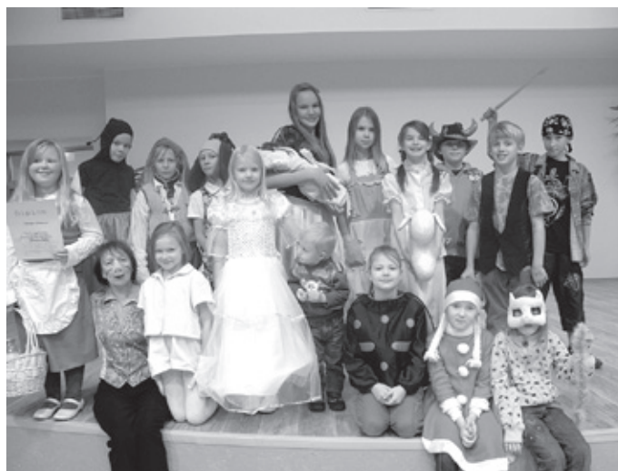
Kostüümipidu Aravete Keskkoolis