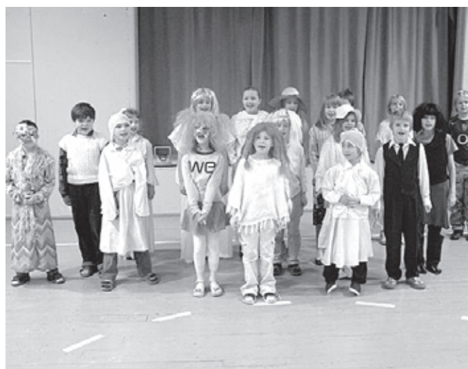
I–IV klasside kadritrall Ambla koolis

I–IV klasside õpilased tähistasid 24. novembril kadripäeva kostüümipeoga. Lisaks esinemistele toimus kadripäevateemaline viktoriin