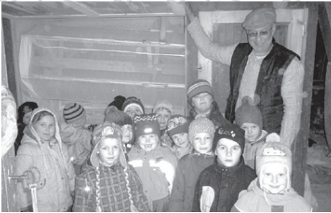
Seidla veski mölder koos mõmmirühma lastega