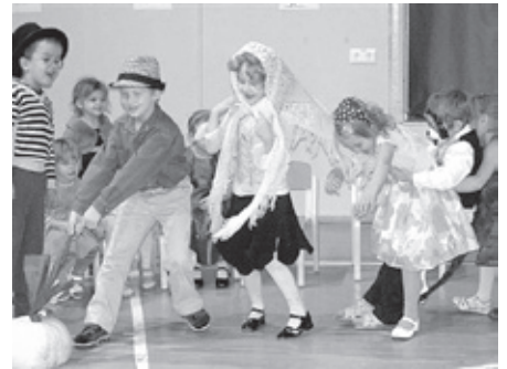
Isadepäeva tähistamine Ambla lasteaias

Oligu kuhi kulda vai mägi hõbedat, kui tervist ei ole, siis ei massa kõik midagi / Eesti vanasõna, reumaseltsi moto /