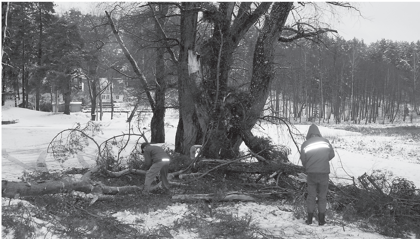
Lauluväljaku ümbruses puudes ragistanud tuuleilid murdsid poole suurest pajust.