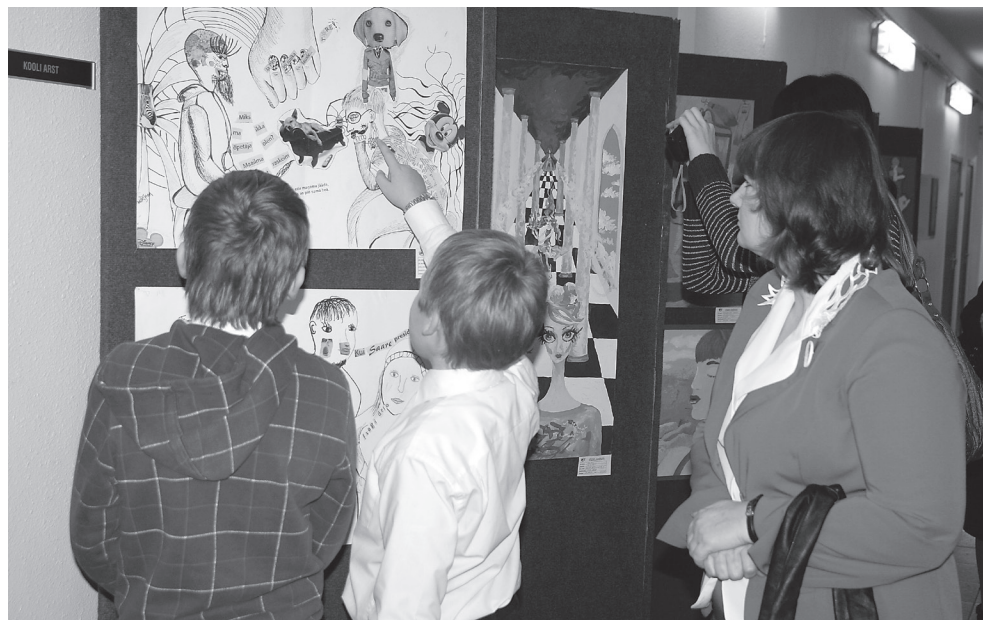
Rakvere laulupoistele pakkusid huvi Jõgeva kunstiõpilaste joonistused.

“Elu peaks olema selline, et me ei peaks lapsi nii palju kaitsma, vaid me