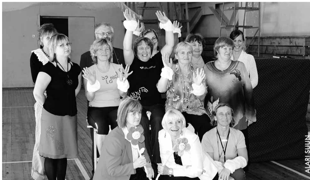
Õpetajad pärast sportlikke mängu