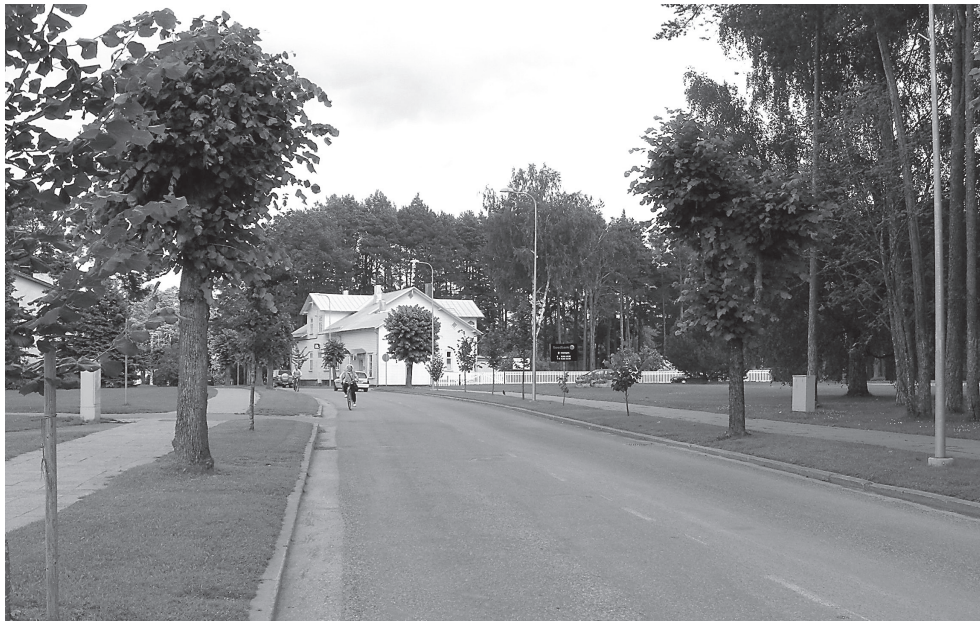
Kesk tänava ebaühtlase ilmega pärnaallee. Foto autor: Edgar Kaare, suvi 2009.

Elva tänavaid hakati korastama ja haljastama 1920. aastatel. Kesk tänava pärnaallee istutati 20. sajandi teises veerandis. Linna kunagisest tähtsamast hoonest, raudteejaamast, lähtuv kahepoolne allee ulatus kuni Puiestee tänavani. Linna selgrooks olev tänav sai ühenduslülilik ajaloolise turuplatsi ja raudteeja-