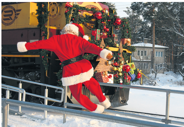
Krapsakas jõuluvana lahkus perroonilt tantsides ja hüppeldes.

Ja viimaks ta tuligi. Rohkete jõulukaunistustega rong näis välja sõitnud olevat lausa muinasjutust. Jõulurongist pudenes välja rõõmsameelne seltskond punastes pükstes ja hamedes päkapikumütsidega tegelasi, mõnedel neist ka pil-