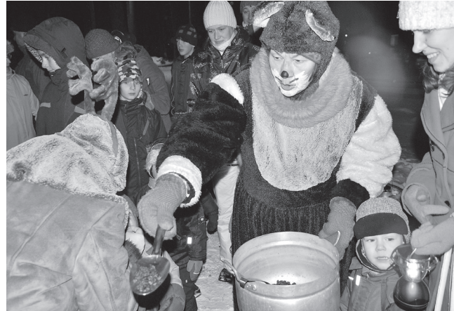
Karuema pakub lastele vitamiiniampsu.