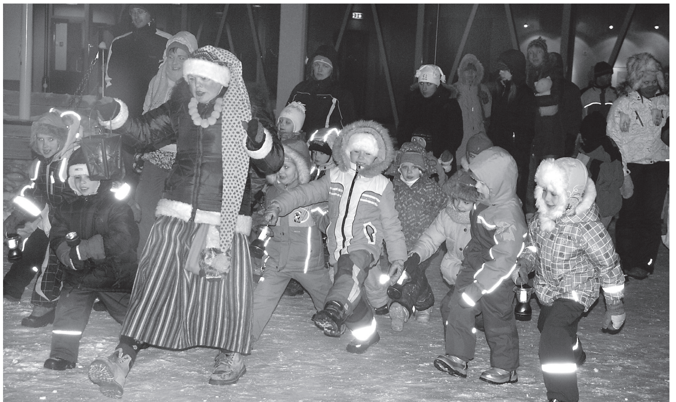
Päkapikuvanaema näitab, kuidas päkapikud kõnnivad – ikka üks, kaks, kolm, neli-hopp ja üks, kaks, kolm, neli-hopp!