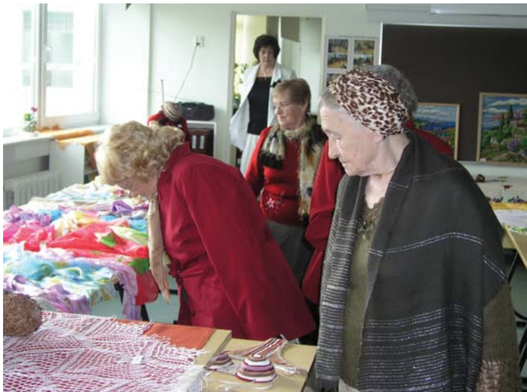
Ühena järgmistest üritustest on tulemas valla käsitööringi kevadnäitus, mis mullu teenis ära suure publikuhoovi.

Varasema rahvusvahelise sotsiaaltöötajate päeva tähistamisel oli eeskujuks Euroopa sotsiaaltöö tegevuspäev novembri teisel teisipäeval, mis nii sattu igal aastal eri kuupäevale. Mullu korraldas Rahvusvaheline Sotsiaaltöötajate Föderatsioon esmakordselt üleilmse sotsiaaltöö päeva 27. märtsil, millega ühinesid sotsiaaltöötajad kõigis maailmajagudes, samuti Eestis. Sotsiaaltöötajate päeva 2008 moto Eestis oli „Sotsiaaltöö puudutab igaüht“. Kuigi sotsiaaltöö oli algselt ellu kutsutud kõige haavatavamate ühiskonnaliikmete abistamiseks, on tegevuse haardeulatus muutunud märksa laiemaks. Päev sotsiaaltöötaja suudab leida lahenduse paljudele erisuguste probleemidele, rõhutavad Eesti Sotsiaaltöö Assotsiatsiooni esindajad . Tõenäoliselt kasutab iga inimene oma elu jooksul mõnd sotsiaaltöö teenust.