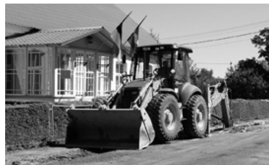
ÜVK torustike paigaldustööd Ambla vallamaja ees 5. juulil