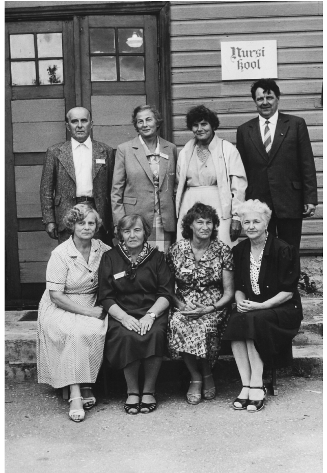
1942.a. lõpetanud kooli 260. aastapäeva kokkutulekul.