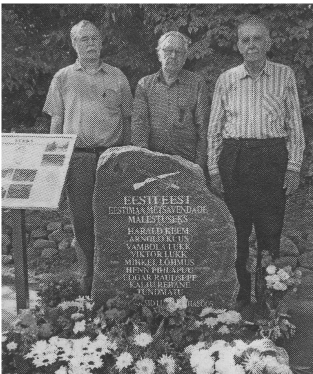
Lüčka punkri mälestuskivi

Sõnuseletamatu tänutunde ja austusega imetlen kõiki neid Nursi koolile pühendunud inimesi, kes on suutnud kõike seda organiseerida, korraldada, teoks teha. Pakkudes sadadele Nursi kooli vilistlastele ühel ilusal päikesepaistelisel laupäeval tundmaks end noorena, taas Nursi kooli õpilaseks. Kohtusid aastatetagused koolivennad-õed ja õpetajad, ununesid hetkeks hallinevad juuksed või murekortsud otsmikul, meenutati neid, keda ei olnud meie keskel. Aga koosolemise rõõmust ergastatutena mindi laiali heas usus kunagi taas kohtuda siinsamas armsas Nursi koolimajas, paratamatult paljudel aga ka igaviku teedel.