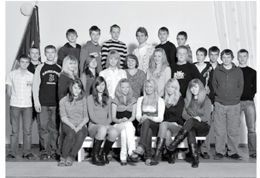
ARAVETE KESKKOOLI IX KLASSI LÕPETAJAD