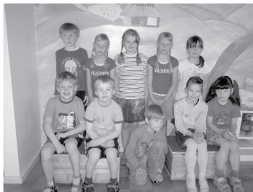
ARAVETE LASTEIA MESIMUMM LÕPETAJAD