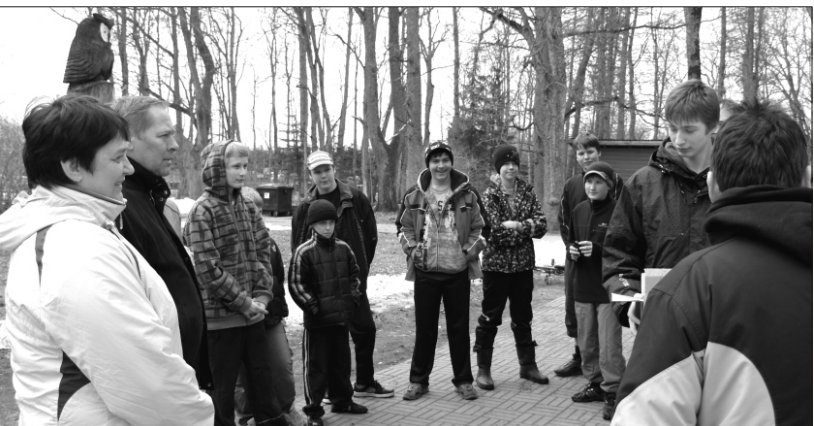
Osalejad instruksiooni kuulamas

Esimeses kontrollpunktis said võistkonnad, kes koosnesid kahest koolilapsest ja ühest valla ametnikust, enda valdusse ühe jalgratta, mis oli abimeheks edasiliikumisel järgnevatesse punktidesse. Lisaks veel ülesande leida täpselt 1 kg kaaluv kivi, mis tuli finišisse jõudes kaalukaussile asetada.