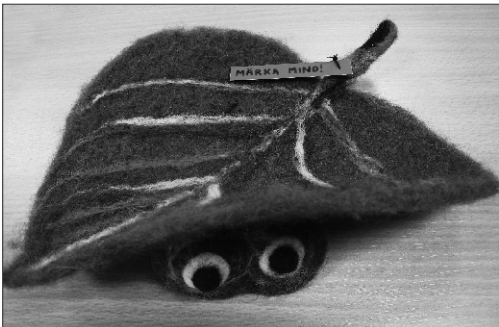
Valve Lindla "Märka mind"