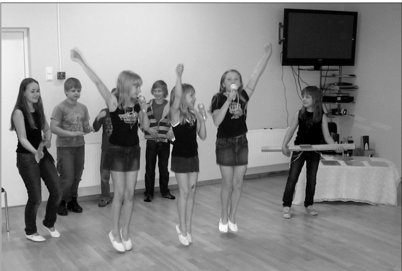
4. klass oma võidulugu esitamas