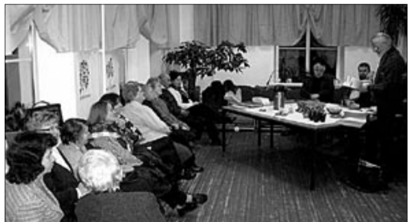
● Mulgimaa raamatukogus oli meeldiv võimalus kohtuda Abjas korraga nelja Eesti kirjanikega.