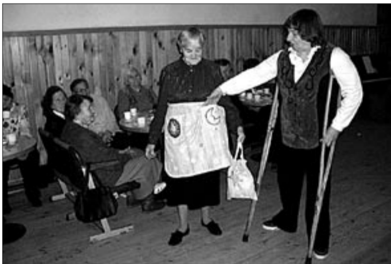
● Puudeinimeste ühenduse novembrikuisel koosviibimisel Mõisakülas esitlesid sealsed käsitöömeistrid kauneid omatehtud põllesid ja käsitöökotte.