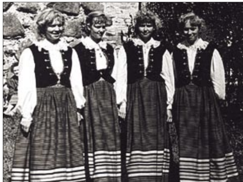
● Abja kultuurimajas 1950-ndatel aastatel tegutsenud topelt-duett Karksi lossimägedes.