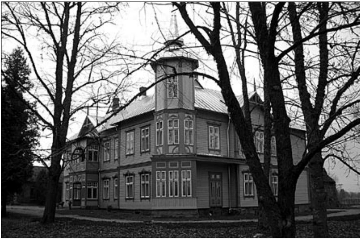
● Sajandivanuses omaaegse Puka talu taastatud häärberis Hallistes avati uue eakatekodu esimene järk, mis on valmis pakkuma eluaset kahekümne kuuetele vanurile.