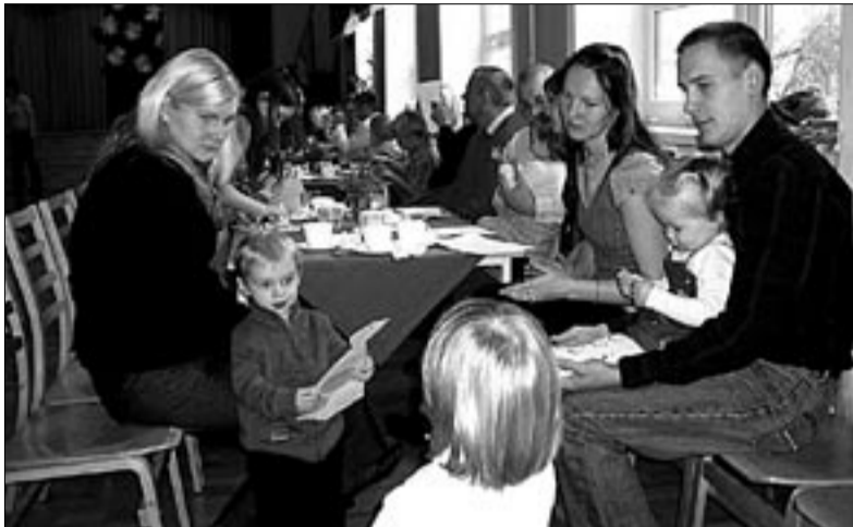
● Abja Gümnaasiumi ruumes toimus isadepäeval vaheldusrikka kavaga osavõturohke perepidu.