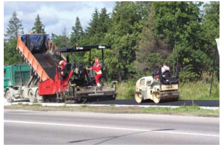
Rannamõisa kirikust Tabasaluni kulgev kergliiklustee valmis septembri lõpus.

Kõige rohkem vöib suvistest teetöödest rahul olla Rannamõisa lasteaia ümbruse teede remondi kvaliteediga, märkis abivallavanem. Uue teekatte saanud Merepiiga teele rajati ka ringtee, lasteaed sai uue autoparkla. Ümbruskond sai korraliku tänavavalgustuse. Korda tehti Hülgeküti ja Paekalda tänavad, samasse piirkonda jääv Käbi tee ja suur osa Tammede alleest. Tööde kogumaksumust 6,7 miljonit krooni rahastas vald, tööd teostas samuti OÜ Rapla Teed.