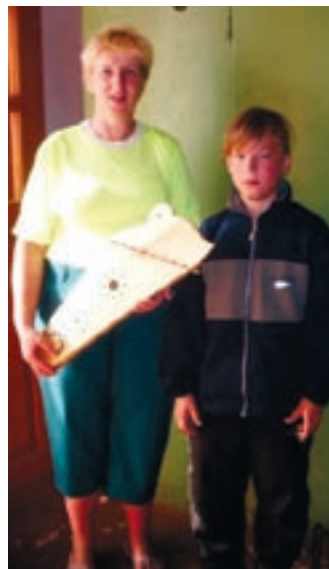
Suvekoolis käisid ka kandlemängijad.

Möödunud suvel osales erinevates suvelaagrites kokku 21 Jõgeva muusikakooli õpilast ja 5 õpetajat. Puhkpilliõpilased olid Elvas, Rõuges ja Põltsamaal. Viimases said koolitust ka viiuli- ja kitarrilõpilased. Rahvamuusikahuvilised valmistasid kandleid ja näitasid oma oskusi Obinitas ja Viljandi ETNO-l. Meenutame suve, avaldades mõned muljed laagrilistelt endilt.