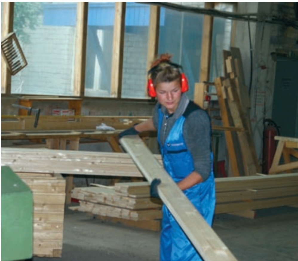
Ettevõtlusnädala raames saavad huvilised tutvuda AS-iga Valmeco, et oma silmaga näha, mida seal tehakse.

Jõgeva on areneva ettevõtlusega linn ning siin tegutseb palju edukaid ettevõtjaid. Juuresolevad arvud kinnitavad seda. Justiitsministriregistri keskus andmetel oli Jõgeval 15.