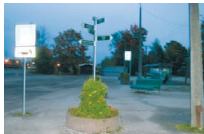
Hilisõhtul on bussijaama plats vaikne, kuid päeval vajavad mugavat bussiooteruumi paljud inimesed.

“Need kaks protsessi pole omavahel seotud. ATKO Grupi-