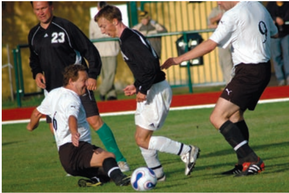
Esimesel jalgpallimatšil Jõgeva staadionil augustikuu lõpus olid vastamisi FC Jõgeva ja FC Toompea.