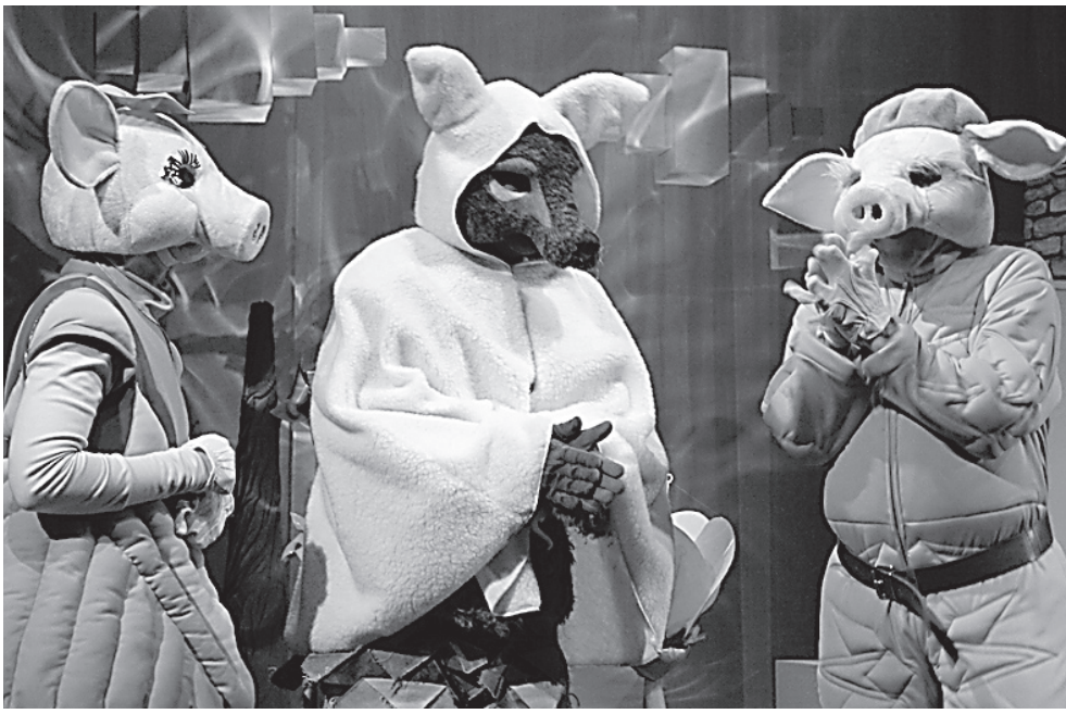
Kaks põrsakest ja hea hunt.