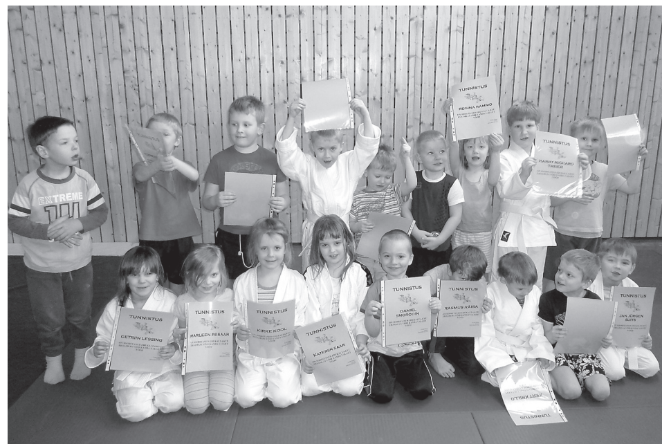
Sügisel treeninguid alustanud väikesed judokad jõudsid esimese astmeni – valge võõ eksam on sooritatud.