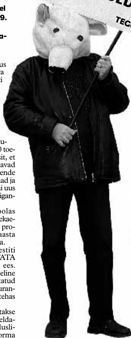
Jääkarumaskis demonstrant Kopenhaageni kliimakohtumise ootel.

ME VÕINUKS PEATADA KATASTROOFILISE KLIIMAMUUTUSE ... ME EI TEINUD SEDA TECUTSE PRAEGU – MUUDA TULEVIKKU KOPENHAAGEN 2009