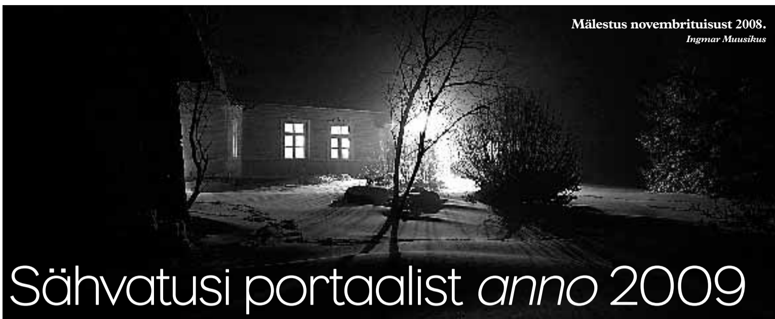
Mälestus novembrist 2008.