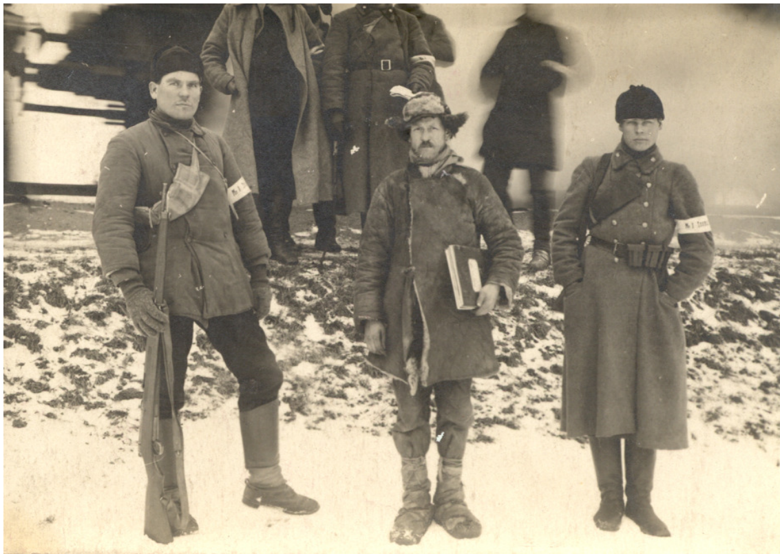
Erik Heinmaa arhiivist pärit foto tagaküljel on tekst: Uus mõisa härra, Paluwere mõisa ülewõtja. Endine mõisa ööwaht.