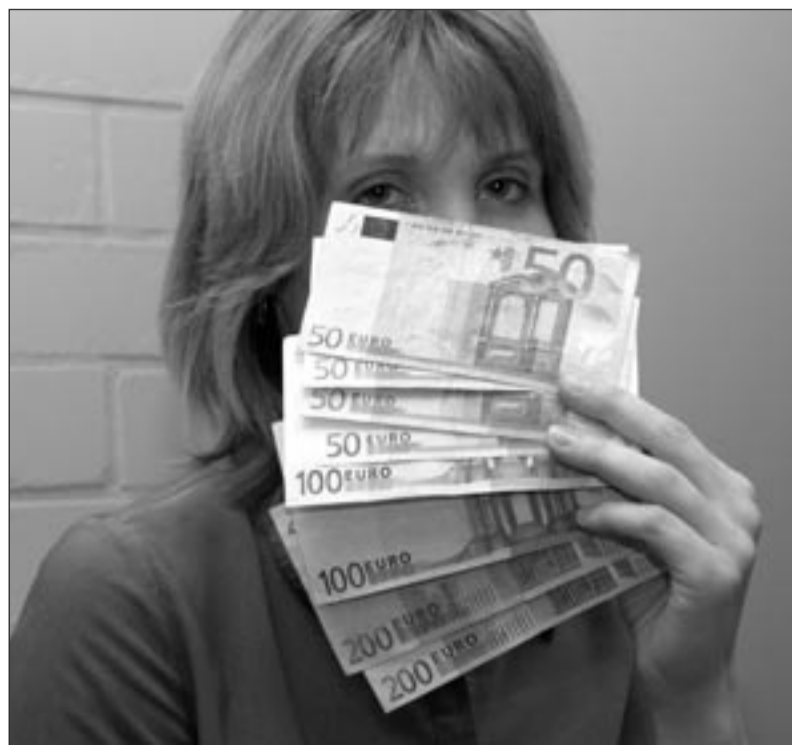
Arva ära – millised on õige rahatähed, millised võltsitud Eurod?

Sularahakeskuses käideldakse kümnetkonda erinevat valuutat. Muude rahade sekka sattunud haruldased eksemplarid korjatakse välja – näiteks värviliste templitega dollarid – ning saadetakse mõnda panka. Kuna sellistel rahadel on numismaatiline väärtus, siis käivad numismaatikud pankades aeg-ajalt neid küsima. Vastutulekust kliendile pangad neid ka tellivad.