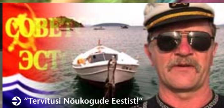
➔ "Tervitusi Nõukogude Eestist!"