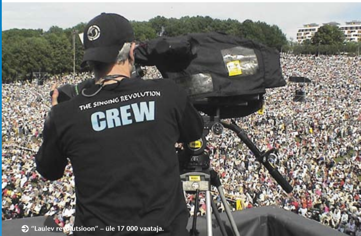
➔ "Laulev revolutsioon" – üle 17 000 vaataja.