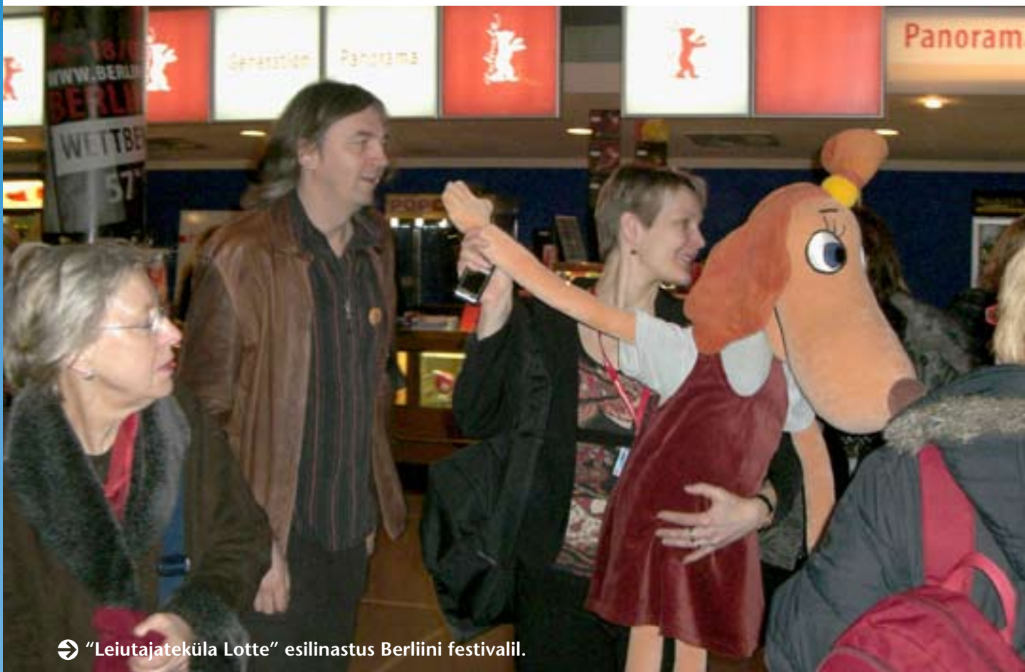
➔ “Leitujateküla Lotte” esilinastus Berliini festivalil.

Kaks eesti lühifilmi on 2007. aastal linastunud kuuel festivalil. Sealhulgas võiks ära mainida “Tühiranda” (rež Veiko Õunpuu), mida on juba näida-