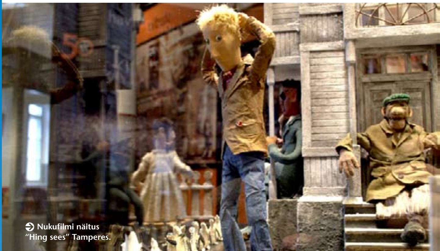
➔ Nukufilmi näitus "Hing sees" Tamperes.

omalaadseid terves maailmas. Nukufilmi näitus oli üks osa festivali lisaprogrammidest ning sai sooja vastuvõtu – kolme nädala jooksul külastas meie näitust tuhatkond last ja täiskasvanut, kes jätsid külalisteraamatusse toredaid kommentaare. Nukufilmi kohaololekut kajastas ka press - Tampere kohalikus ajalehes „Aamulehti“ ilmusid artiklid näituse avamisest ja Eesti nukufilmist ning Tampere festivali ajal „Helsinki Sanomates“ intervjuu Riho Undiga. Tampere festivalil pöörati Nukufilmile suurt tähelepanu ning toimus ka kaks Nukufilmi toodangu seanssi. Vaatamata tehnilistele viperustele (filmiprojektori mootor põles filmi „Vennad Karusüdamed“ ajal kõige põnevama koha peal sisse ning huvilised said filmi lõpuni vaadata näituseruumis DVD-lt) läksid mõlemad seansid edukalt, saal oli täis ja huvi suur.