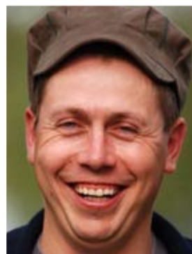
Мальчишь – Кибальчишь.

Lahedat lugemist – vaatamist/ sündmused pildis 2008/ suvapäevad Käärikul