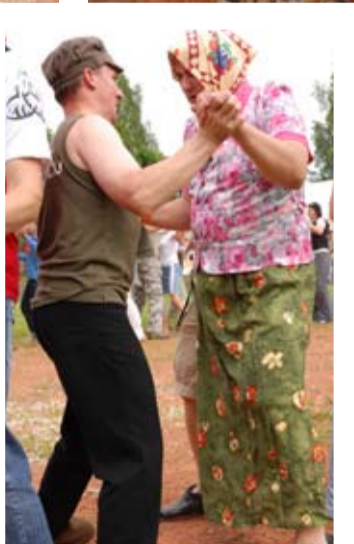
Мальчишь – Плохишь.