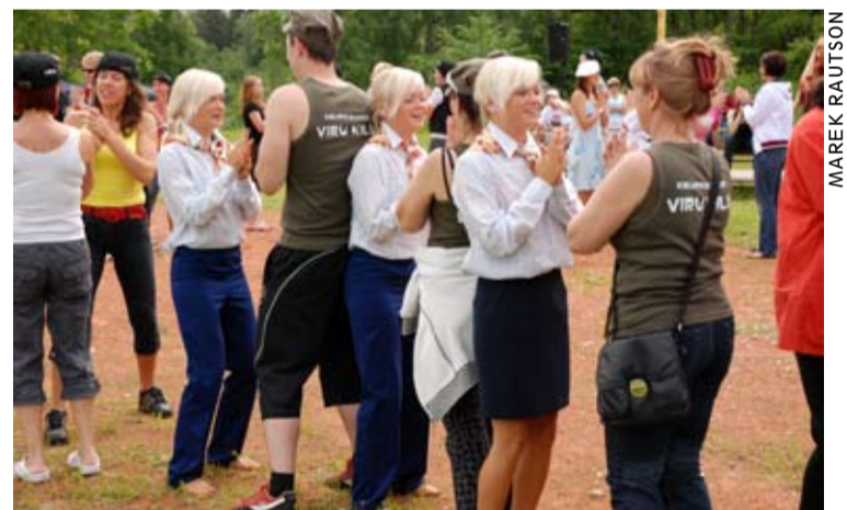
В глазах трюится.