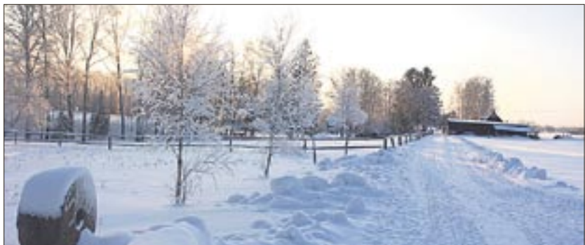
● Siimu talu kesktalvine tee