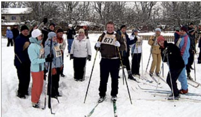
● Suusatajad on stardi ootel.