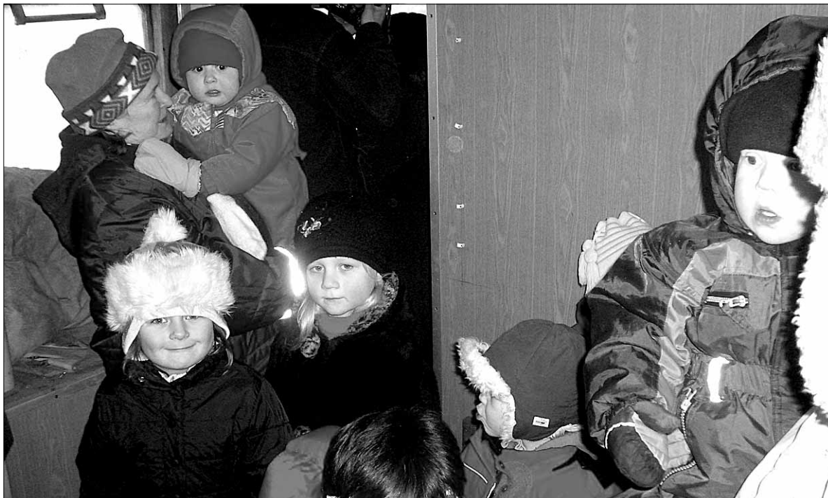
• Kõige pisemad mõisakülalased tegid linnale kingitud vagunis oma esimese põneva rongisõidu.