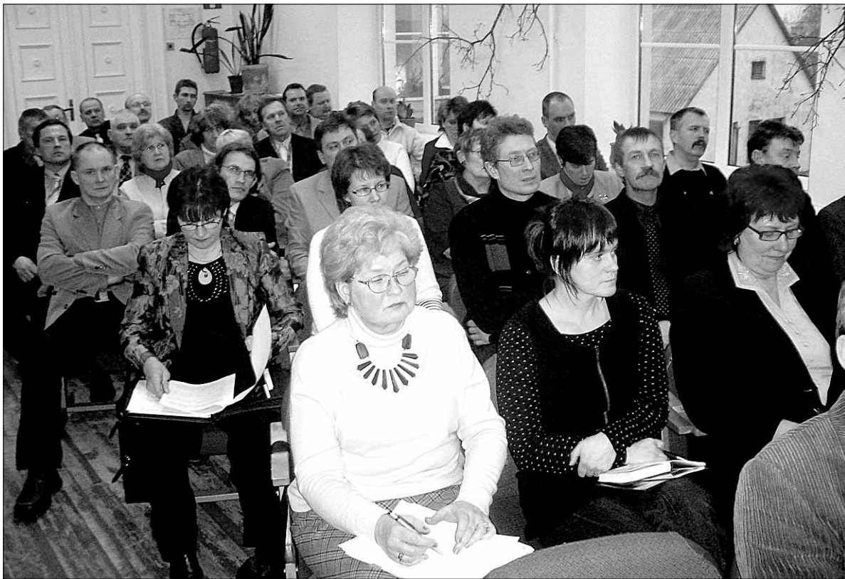
• Ühinemistemalistel mõttetalgutel Abjas osalesid esindajad kõigist Viljandimaa piirese jäävatest Mulgimaa omavalitsustest.