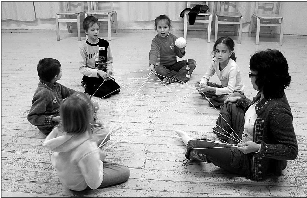
● Tantsutunnis Kosksillal õppisid lapsed ka niidist ämblikuvõrgu tegemist.

Võistlustööd tuleb toimetada hiljemalt 17. märtsiks lähimasse päästekomandosse.