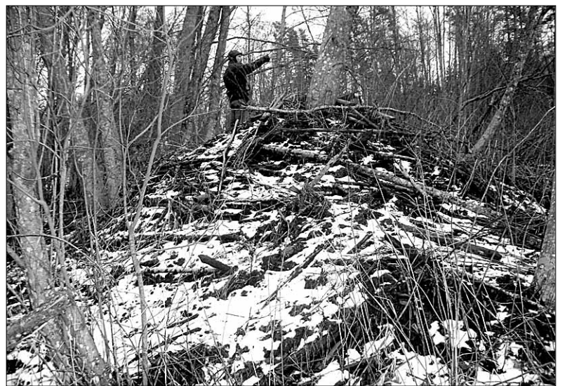
• Aukartust äratav koprapesa jõe kaldal on üks Hendrikhansu vaatamisväärsusi.