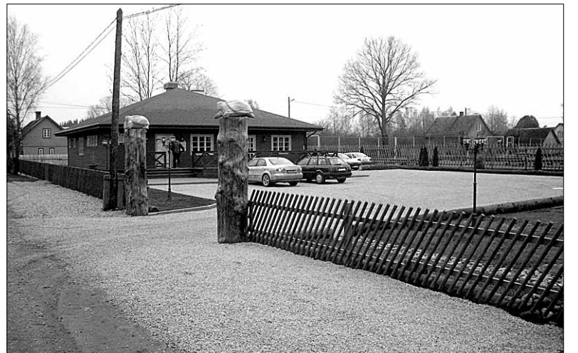
• Mõõdunud aasta novembris avatud Kilpkonna trahter kaunistab rõõmustavalt Abja-Paluoja linnapilti.