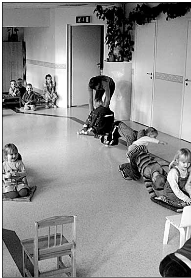
● Nii lasti lumeta vastlapäeval liugu Mõisaküla lasteaias.