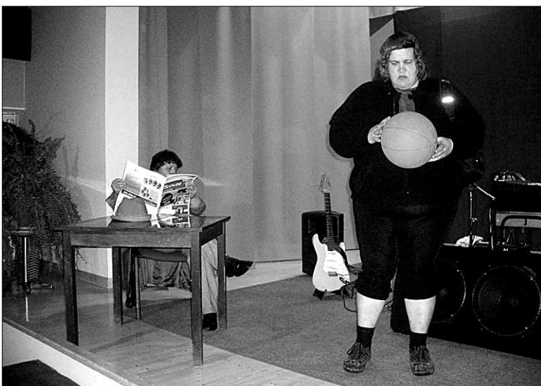
● Kosksillal tegutsev näitering "Vuntsid" mänguhoos.