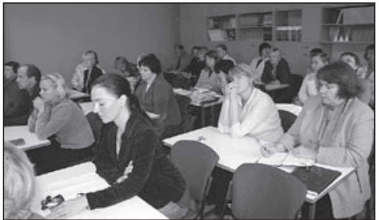
Aravete Keskkooli õpetajad koolitunnis