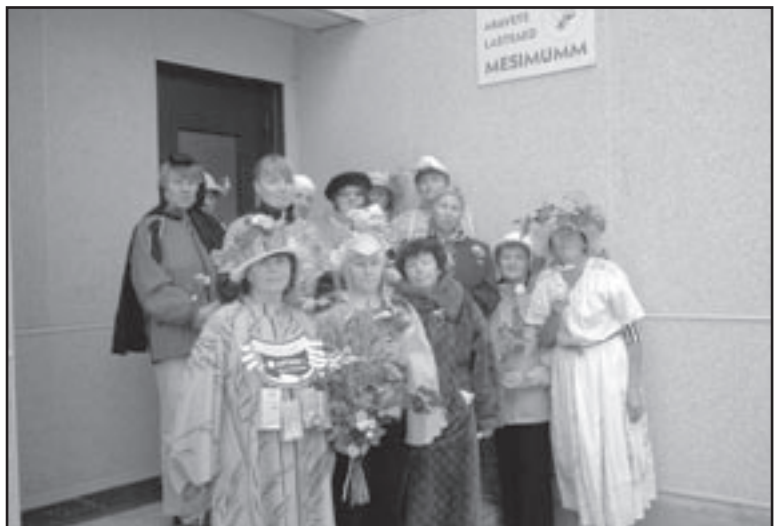
Mesimummi õpetajad-tädid lasteaias sünnipäeval