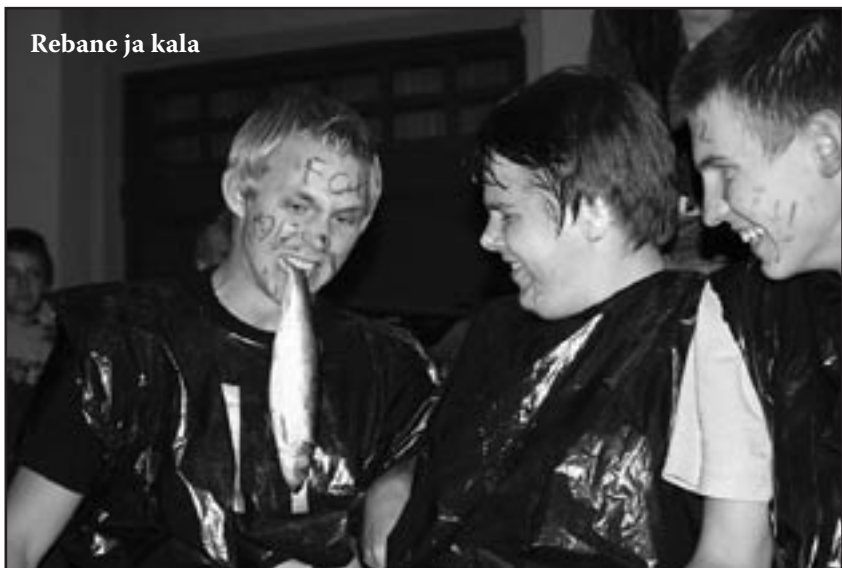
Rebane ja kala