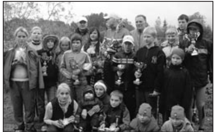
Ümberjärvejooksu seeriavõistluse parimad