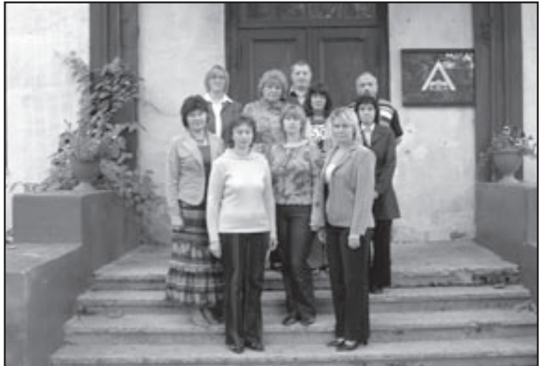
Ambla Põhikooli õpetajad koolimaja uksele