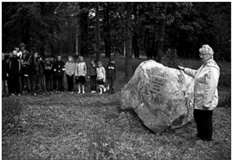
● Mälestuskivi avamisel kunagisele Halliste koolimajale meenutas seal töötatud aastaid endine kauaaegne koolijuht Ene Staalfeldt.