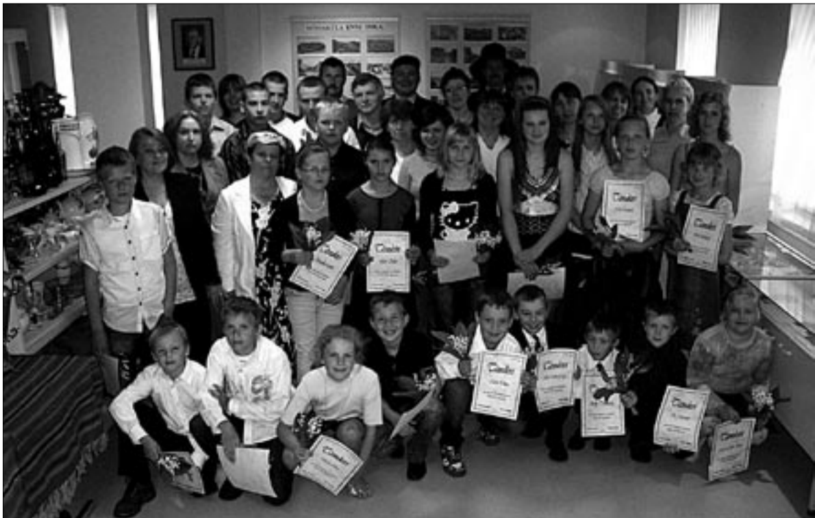
● Tänukirja koos lillekimbuga tubliduse eest lõppenud õppeaastal sai vastuvõtul üle poole Mõisaküla Kooli õpilastest.