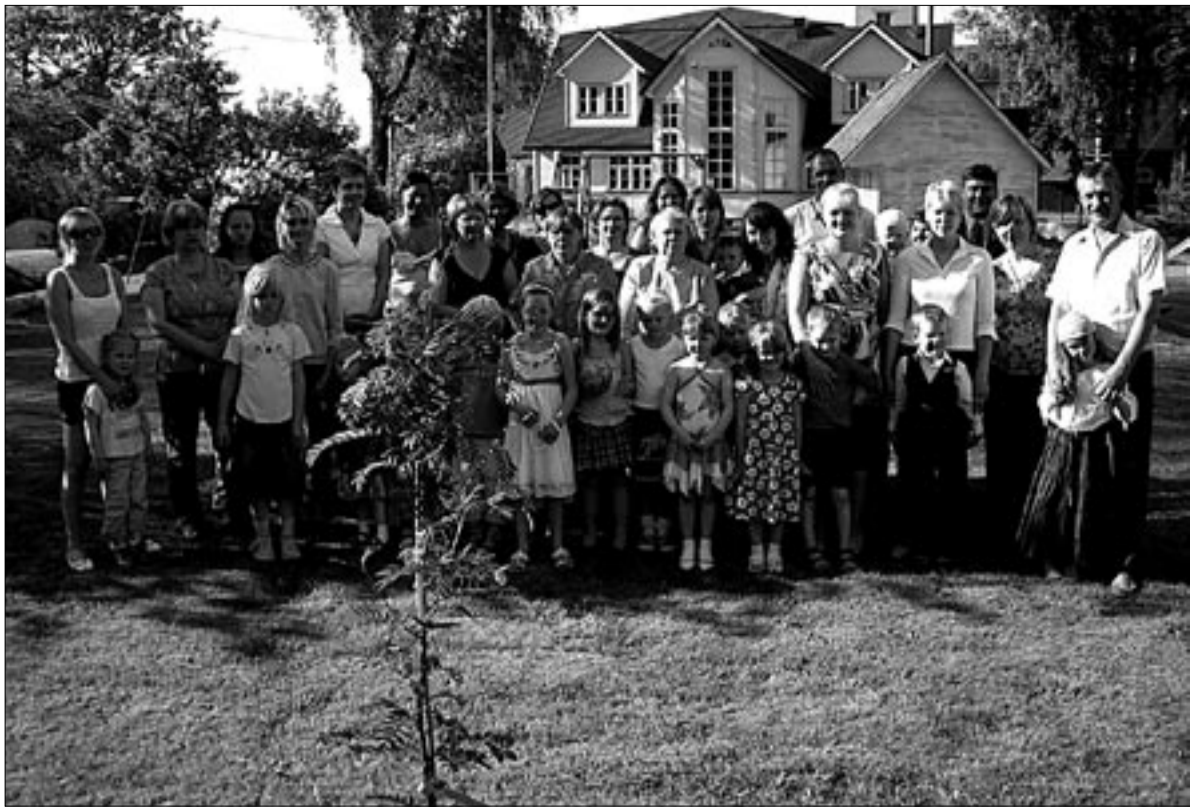
● Kümme aastat kenana seisnud lasteaiamaja (tagaplaanil) hoovi serva istutati aastapäeva puhul pihlakas, mille taustal peolised end ühispildile jäädvustasid.