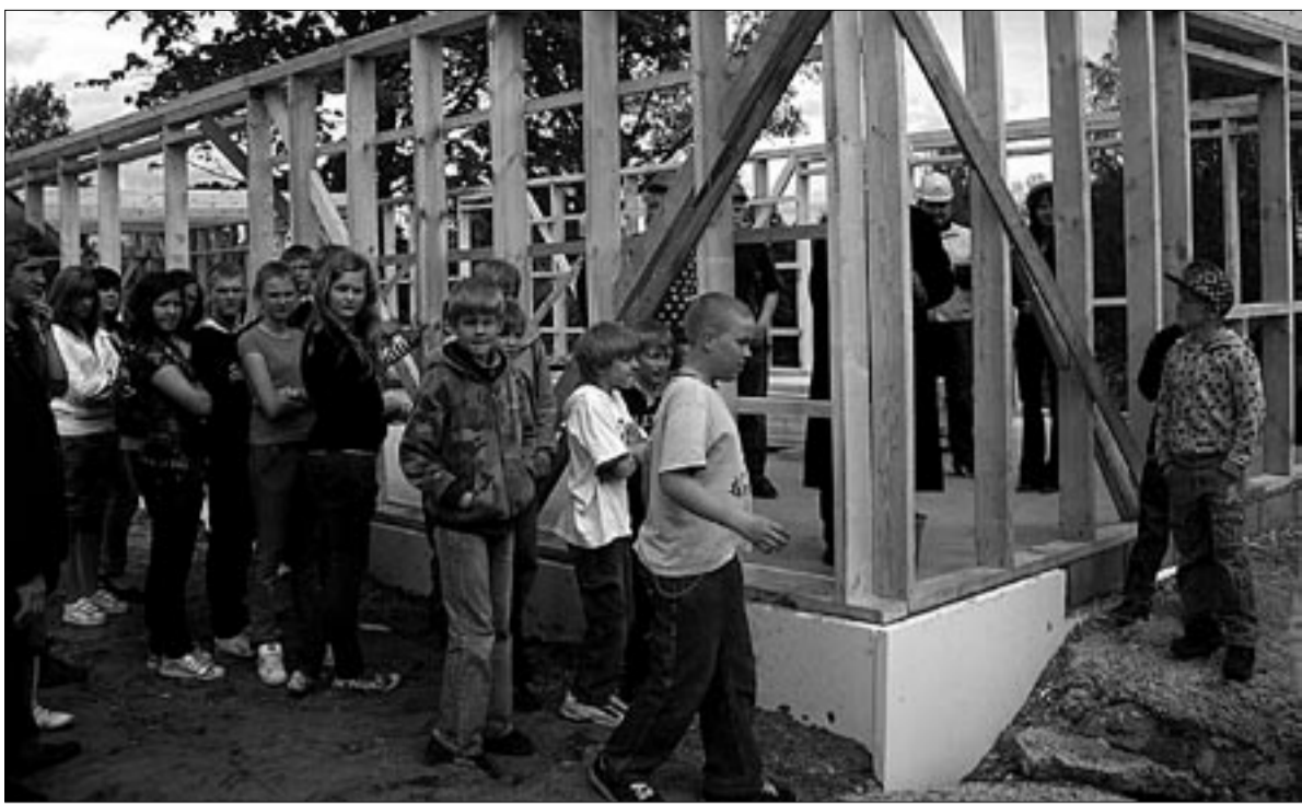
● Abja noortekeskuse tulevase maja pidulikult nurgakivi panemisel arvukalt osalenud noored loodavad juba suvel valmivast hoonest endale huvitavat kooskämimis- ja tegevuspaika.