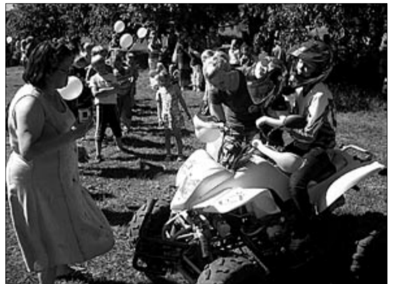
● Nii nagu endale näomaalingute teha laskmist, ootasid lapsed järjekorras kannatlikult ka võimalust põnevaks sõiduks neljarattalise ATV-ga.