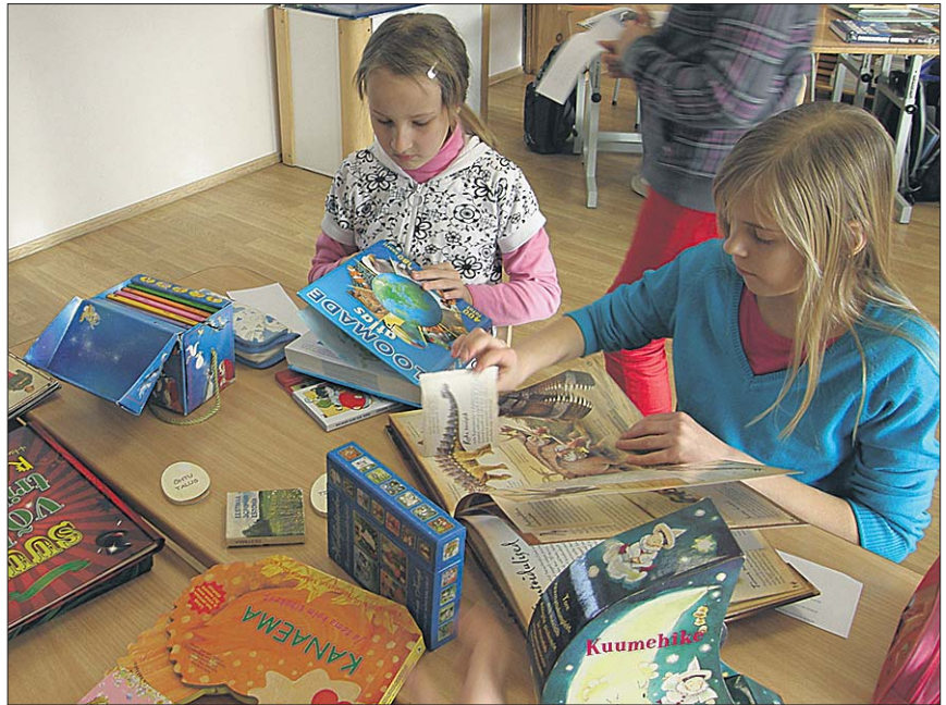
● Lugemiskeskuses jätkus tegevust igale eale.