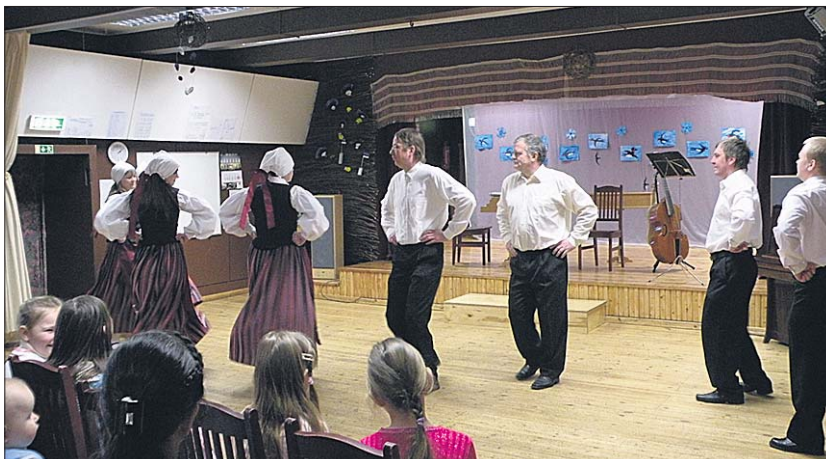
● Esineb Tánassilma rahvamaja segarahvatantsurühm.