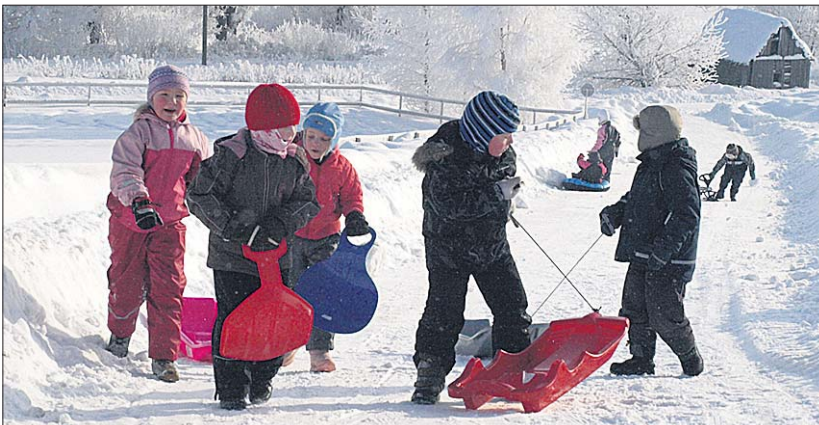
● Kelgumäel oli lastel lõbu laialt.