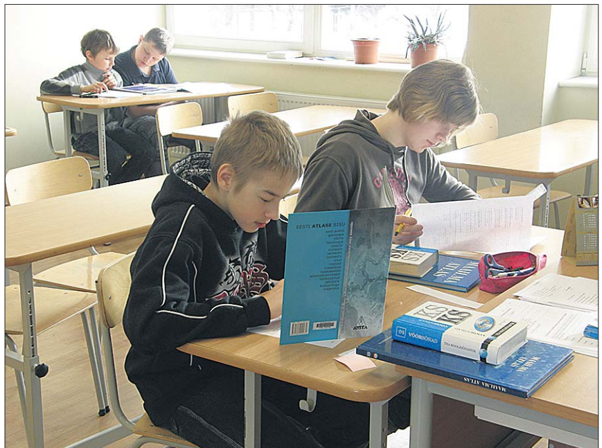
● Õpioskuste keskus meelitas enam poisse.