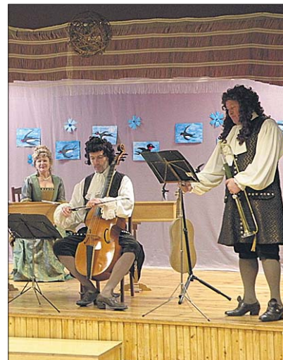
● Laval on barokkmuusikud.