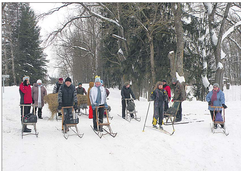
● Pidupäevast osavõtjad on stardi ootel.