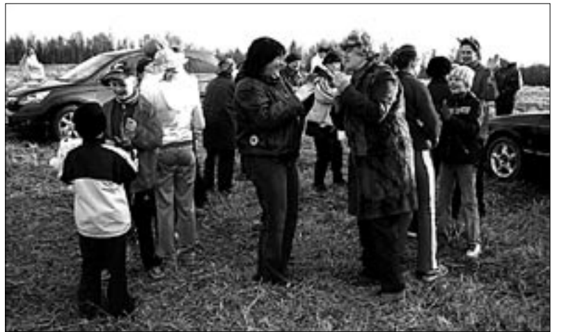
● Linnamäe jalamil.