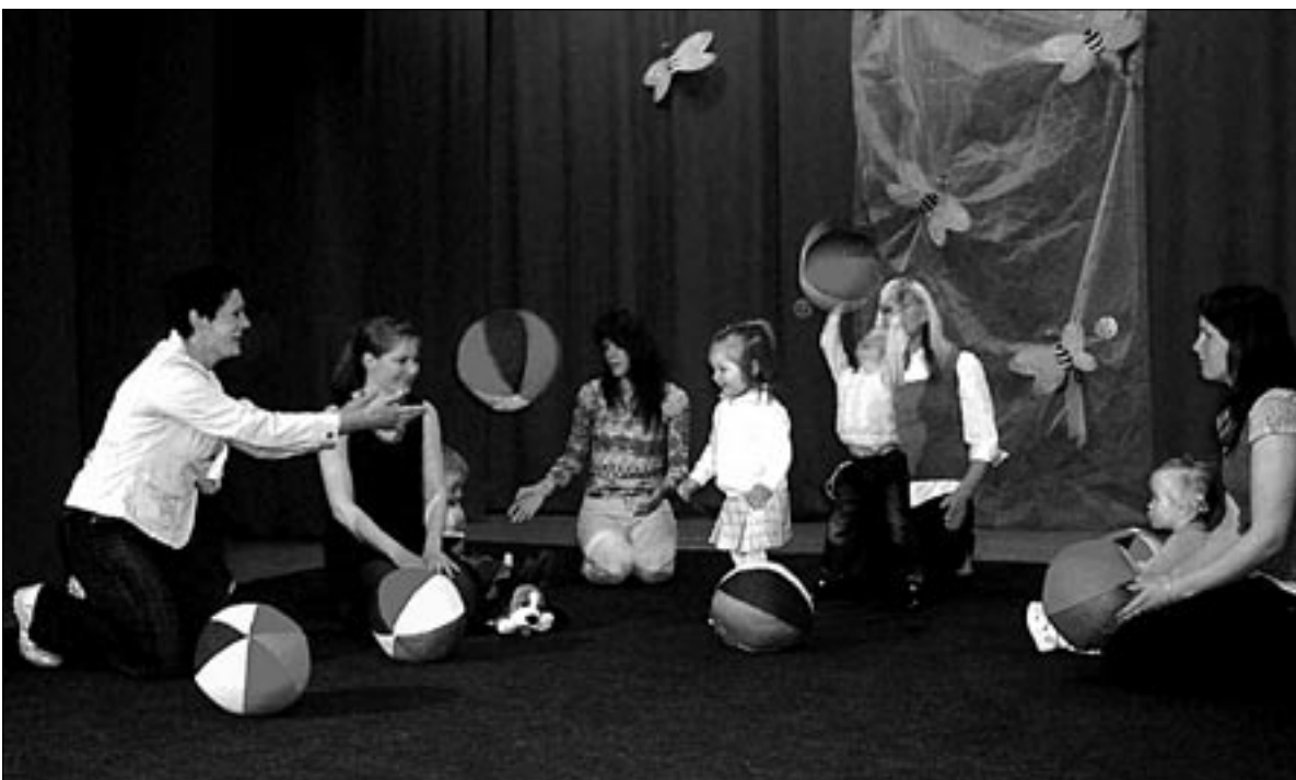
● Hetk emadepäevapeolt Abja kultuurimajas.