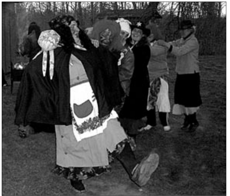
• Üks koht, kus volbriõõ nõiasabatil pöörast tantsu vihuti, oli ajaloolise Sarja vesiveski talu hoov.