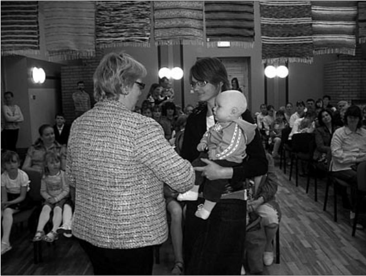
● Emadepäevapeol Halliste rahvamajas anti möödunud aastal vallas emakssaanutele üle väärtuslik lapsele mõeldud esimene raamat.