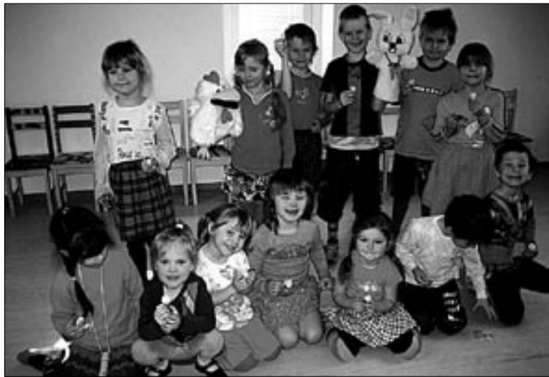
● Munadepüha tähistati Halliste lasteaia meeleolukalt.