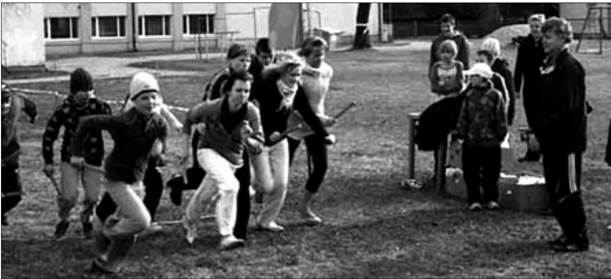
• Jüripäeva jooksul Mõisakülas startis kokku tosin õpilasvõistkonda.