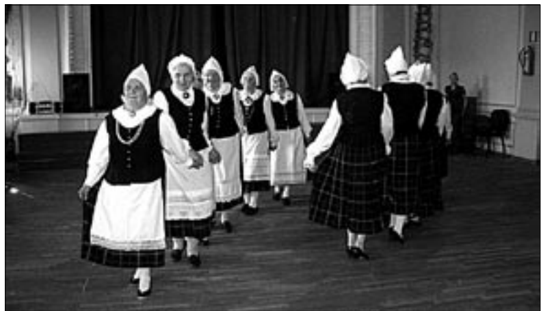
● Meelespea klubi tantsurühm tantsupäeval.