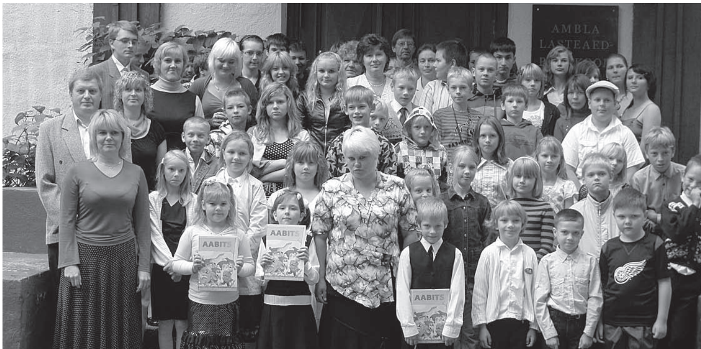
Ambla koolilperel 1. septembril