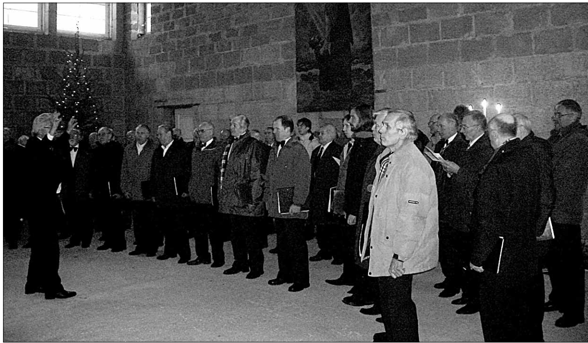
♦ Jõulukontsert Mõisaküla taastatavas kirikus lõppes meeskooride Gaudeamus ja Absolventi mõjusa ühisesenemisega.

"2008. aastal on tööd kiriku taastamisel käinud suvest saadik ega ole praeguseni (20. detsembrini – M.S.) päriselt lõppenud – mõningad väikesed asjad on veel teha.