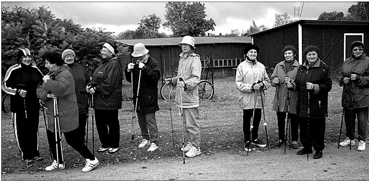
● Tõeline rahvaspordiala on Mõisakülas kepikõnd. Pildil heatujulised kepikõndijad enne retkele asumist kultuurimaja ees läinudsügisel tervisepäeval.