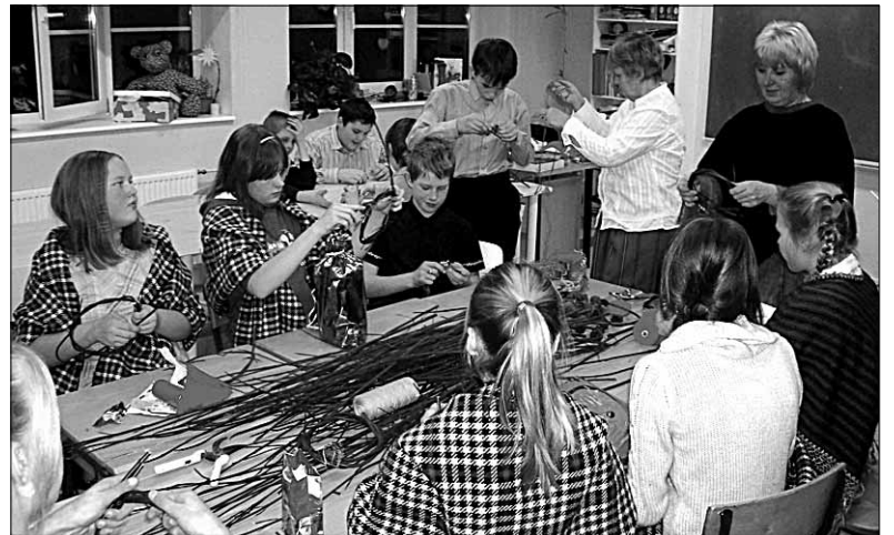
● Meisterdamise õpitoas käis Halliste Põhikooli jõulupäeval erinevast materjalist mitmesuguste jõulukaunistuste hoolas valmistamine.

Tegutsemiseks olid avatud jõuluvana tuba, filmituba, mängude tuba, meisterdamistuba väikestele ja suurtele, nuputamistuba, muusikatuba, võlupildituba, regilaulutuba ja matemaatiliste mängude tuba. Kohvikus pakuti õpilastele tasuta salatit, kooki ja kakaod.