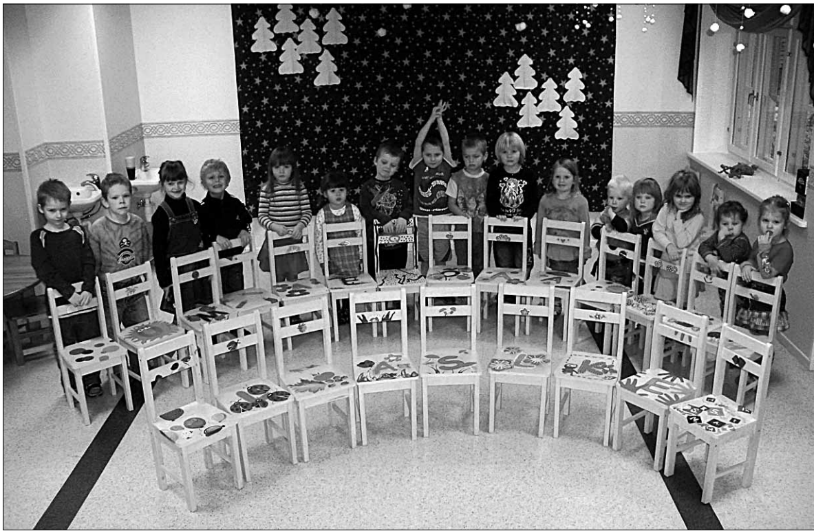
● Koolilt jõuluringiks saadud rõõmsatooniliste toolide taga seisavad rahulolevalt igauks endale lemmiktooli leidnud lasteaia vanema rühma kasvandikud.