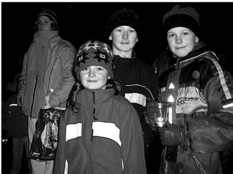
● Mõisaküla noored (pildil) ja vanad tervitasid keskvaljakul jõlukuuse all rõõmsalt nii adventiaja algust kui ilutulestiku särast saabunud uut aastat.