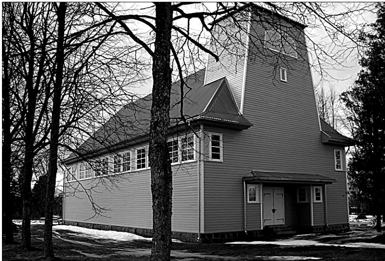
♦ Tänu PRIA ligi miljonikroonisele toetusele möödunud aastal tublisti edenenud ehitustööd juba päris kena ilme võtnud taastatavas Mõisaküla luterlikus kirikus jätkuvad ka tänavu.

Tänavu tahaks ära teha kiriku torni, põranda ja lae. Betoonpõrandale tuleb peale laudpõrand, plokksseinad krohvitaakse ja lagi tuleb samuti puudust. Kui õnnestuks kõik need kolm