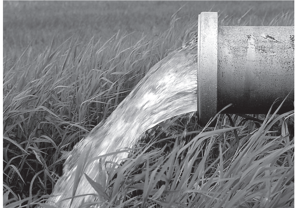
Torühendused tuleb lasta teha oma ala spetsialistidel!