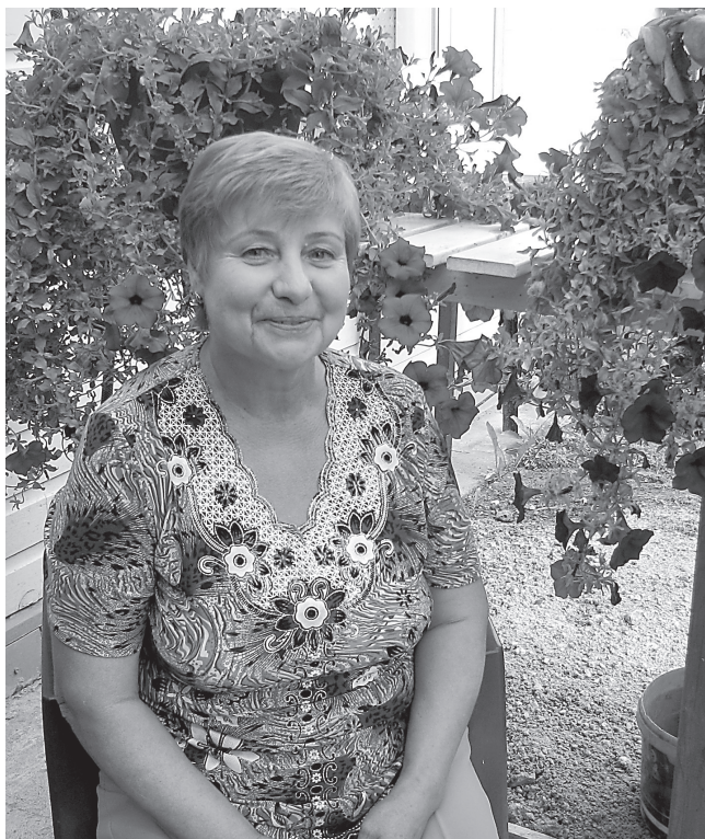
Et kass Vaska on jälle redus, tuleb pühapäeval 65. sünnipäeva pidaval juubilaril üksinda oma lillede keskel poseerida.

Eestis sündisid ühel ajal Anneli ja Andres. Kui lapsed läksid lasteaeda, siis läksin õppima pagar-kondiitriks ja töötasin Tartus raudteejaama restoranis ligi 27 aastat. Kui tuli kroon, siis pandi see kinni. Siis töötasin võibolla paar aastat Pekka juures [Karima OÜ]. Viimane töökoht pagarina oli mul Kohvipoes. Siis kutsuti mind Enicisisse.