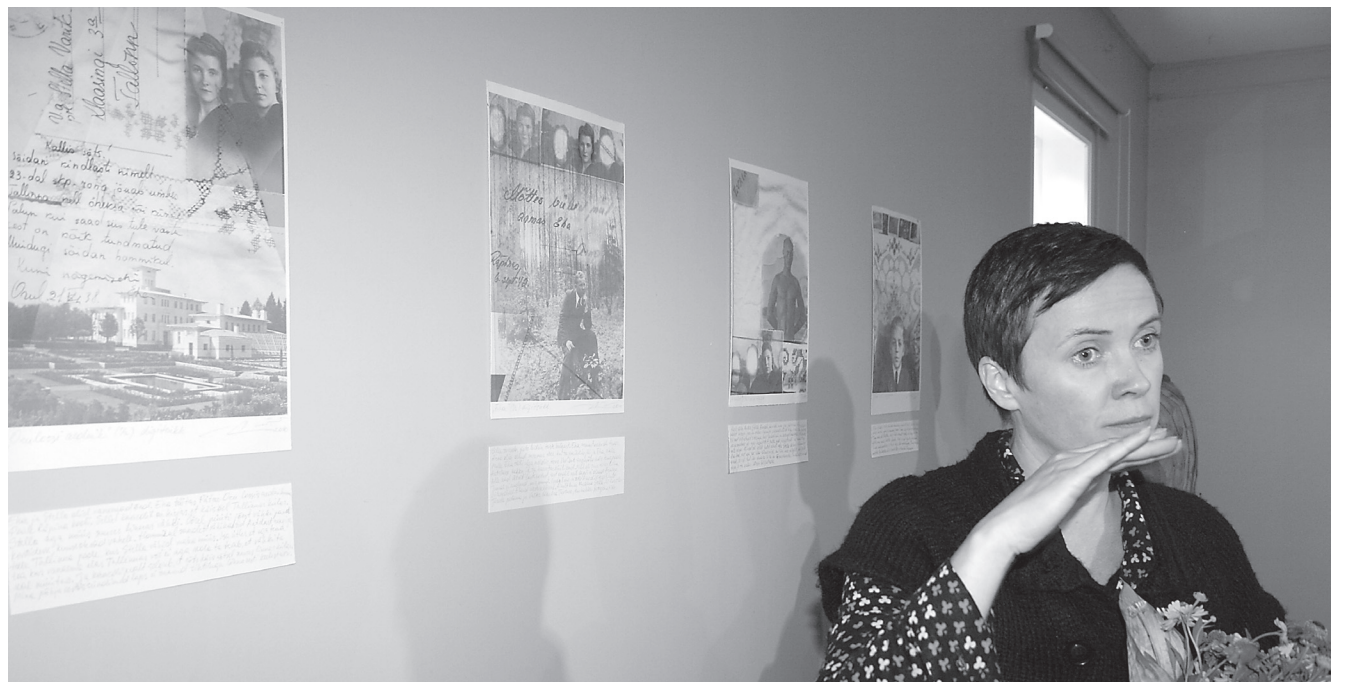
Näitusel “Kaduvad” juurdleb kunstnik Eveli Varik selle üle, kui vähe me mäletame ja kui kaduvad me oleme.