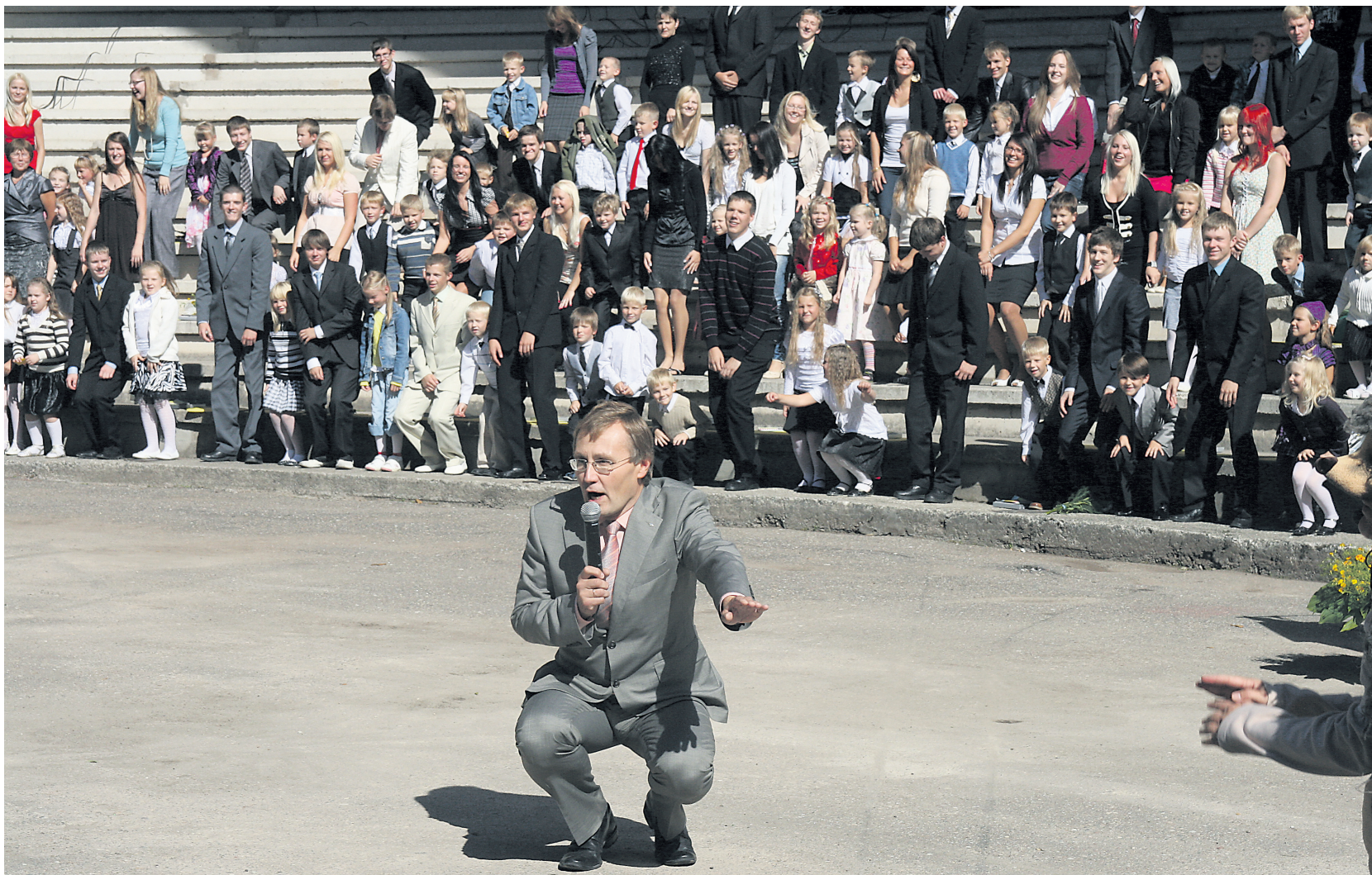
Kui päevakangelased ei suutnud enam kogu seda tarkust vastu võtta, mida kõnelejad pakkusid, päästis esimese koolitunni haridusminister Tõnis Lukas, kes kasutas oma koolmeisteriajast meelde jäänud ergutusnippi ja pani kogu lauluväljakutäie rahvast laulma ja kükke tegema.