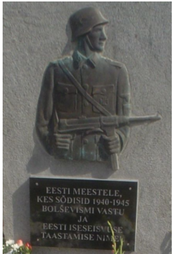
Ausammas, pildistatud veel siis, kui see veel Lihulas oli!

Niisiis muinasajast tänapäevani on Lihula rahvale olnud püha vabadusepüüe ja armastus oma iseseisva maa vastu.