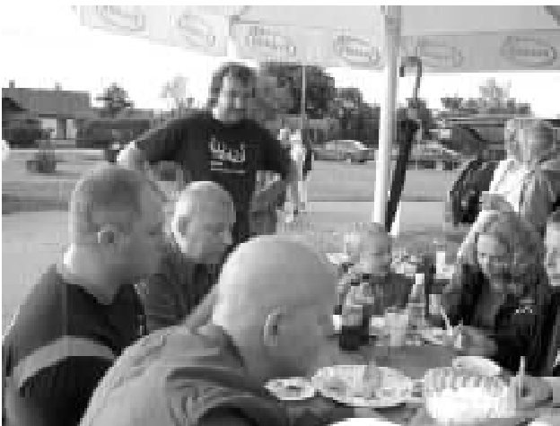
Grillimisvõistluse žürii hindamas erinevaid kala- ja liharoogi. Parimaks tunnistati loomulikult grillitud kala.