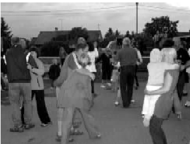
Ansambel "Untsakad" pani tantsima nii suured kui ka väikesed.