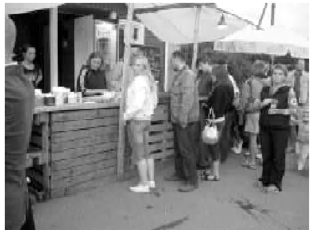
Wana Kala kõrts kolis ürituse tarbeks välja ja järjekord baarileti taga püsis varajaste hommikutundideni.