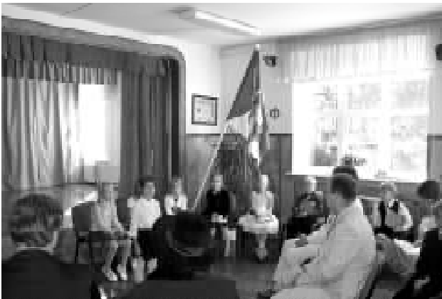
Aukohal istusid seekord 8 esimese klassi õpilast.