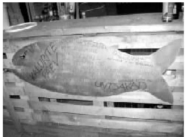
Ürituse kava oli kirjas lõbusal kala-kujulisel plakatil.