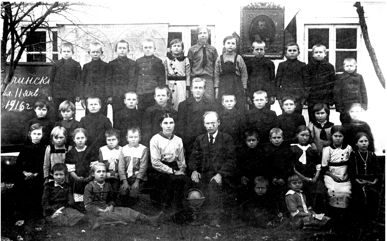
Foto Džurtši külakooli õpilastest ja õpetajatest 11.jaanuaril 1916.aastal, Esimese Ilmasõja teisel aastal oma koolimaja taustal. Maja ehivad viimase vene keisri Nikolai II portree ja lipud. Üks neist peaks olema Vene impeeriumi lipp. Aga teine? Kas Krimmi kubermangu lipp? Välja on toodud tähtsamad õppevahendid: poolkerade kaart, gloobus, arvelaud ning klassitahvel.

Džurtši oli jõukas eestlaste küla Venemaal Krimmi kubermangus Perekopi maakonnas, kuhu Eestist väljarändajad asusid 1863.aastal.