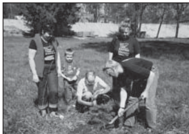
Räpina Kammerkoori lauljad istutavad laulupeo sallu oma puud