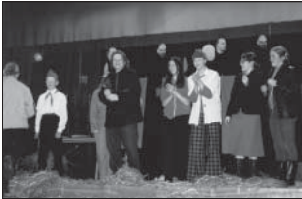
„Leegitsev Loojang” etenduse autor ja tegelased Räpina Rahvamaja lavalt pärast esietendust

Autori ja lavastaja mõtteid ja tähelepanekuid lavaloost „Leegitsev Loojang”, Räpina ajalehele.