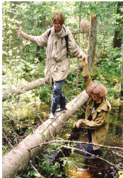
Soomaal liikumiseks vajab brüoloog sageli kõrvalist abi.

vaadates. Aga et vesi pidevalt üle põlve ulatub, selgus alles kohale jõudes (vt. pilti). Algul ikka püüdsime mättalt mättale hüpates kirjelduste tegemiseks kuivemaid kohti valida. Nii mõneski analüüsiruudus ilutseb aga märkus: vesi üle 30 cm, samblad vee all. Päeva lõpus muutus see karglemine enamasti mõttetuks, sest saanud ühe jala märjaks, oli lihtsam juba otse minna.