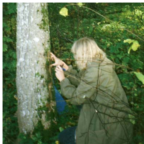
Samblasõber "altari" ees põlvitamas.