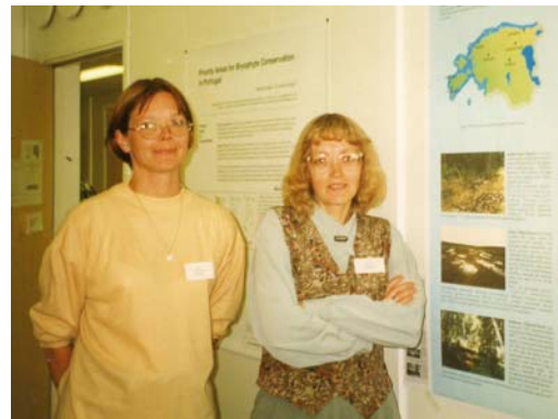
Meie poster on kõige ilusam!