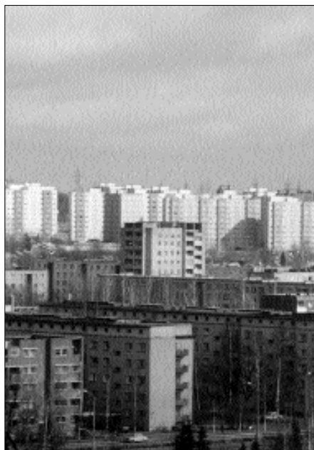
SUURED PANEELLAMURAJOONID LAUSA SOODUSTAVAD KURITEGEVUSE VOHAMIST

Territooriumi märgistamine ehituskujunduslike elementide kasutamisel (kõnniteed, territooriumi haljastus, väravad, aiad, tõkkepuud jms) eesmärgil on eraldada avalikke ning eravalduses olevaid maa-alasid, anda