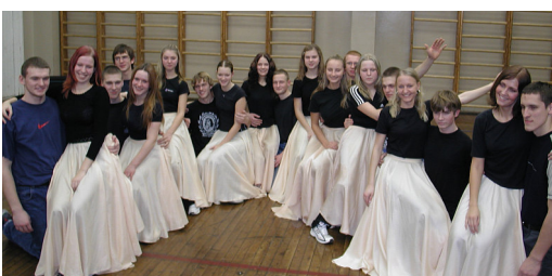
12.d klassi võimlejad