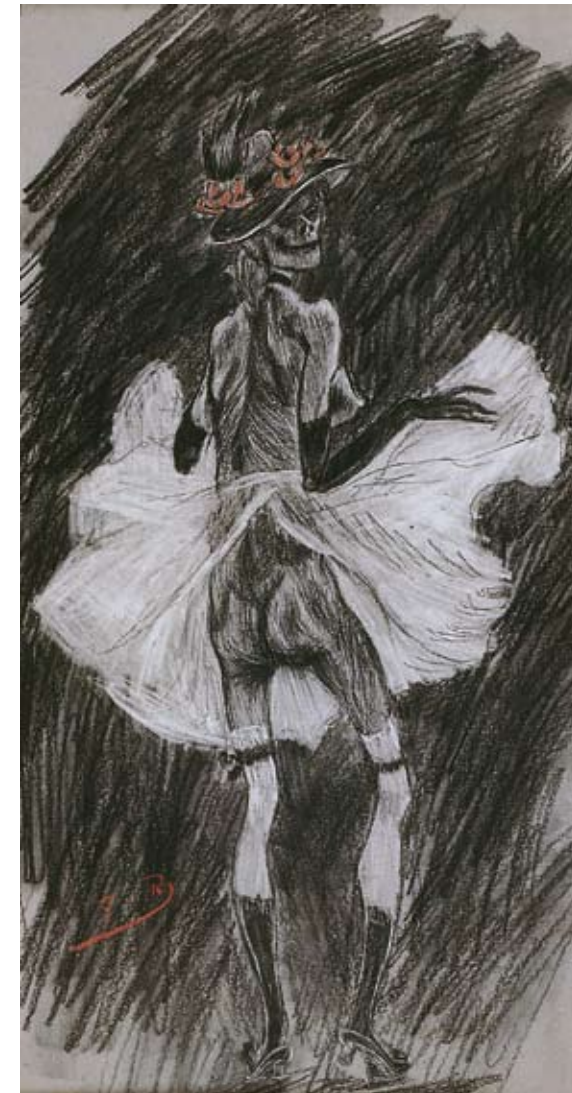
Félicien Rops. Tantsiv surm. U. 1865. Pliats, sangviin, valge kriit. Félicien Ropsi muuseum, Namur

Belgia Valloonia regiooni pealinnast Namurist pärit Félicien Rops (1833–1898) on üks tuntumaid dekadentsiajastu kunstnikke, kes tänasele vaatajale mõjub arvatavasti oma ajastu andeka krooniku, psühholoogi ja kriitikuna. Sitsikangastega kaupleva mehe jõuka järeltulijana tundis Rops suurepäraselt kodanliku elulaadi ja kombeid, nautis majandusliku kindlustatusega kaasnevat hüvesid. See-