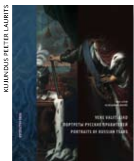
KUJUNDUS PEETER LAURITS