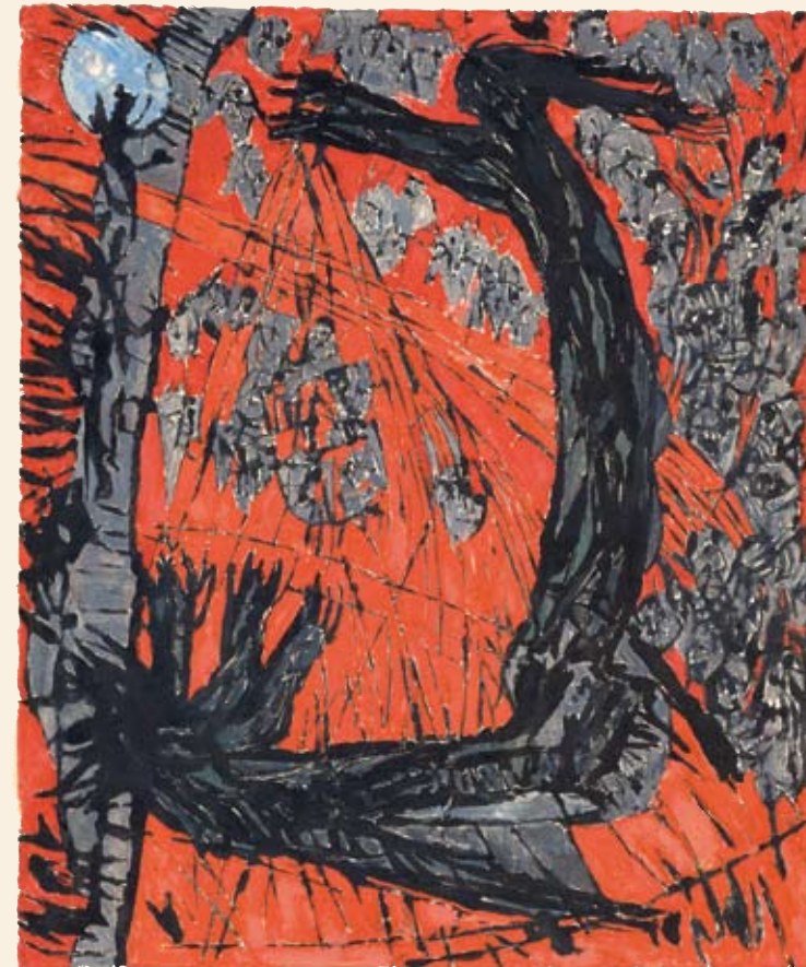
Herman Talvik. Näitemäng põrgus. 1954. Monotüüpia. EKM

Näitus "Herman Talvik 100" Adamson-Ericu muuseumis 11. märtsini 2007