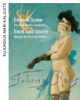
KUJUNDUS MARI KALJASTE

Koostajad Mai Levin, Aleksandra Murre Kujundaja Peeter Laurits Eesti, vene ja inglise keeles 280 lk