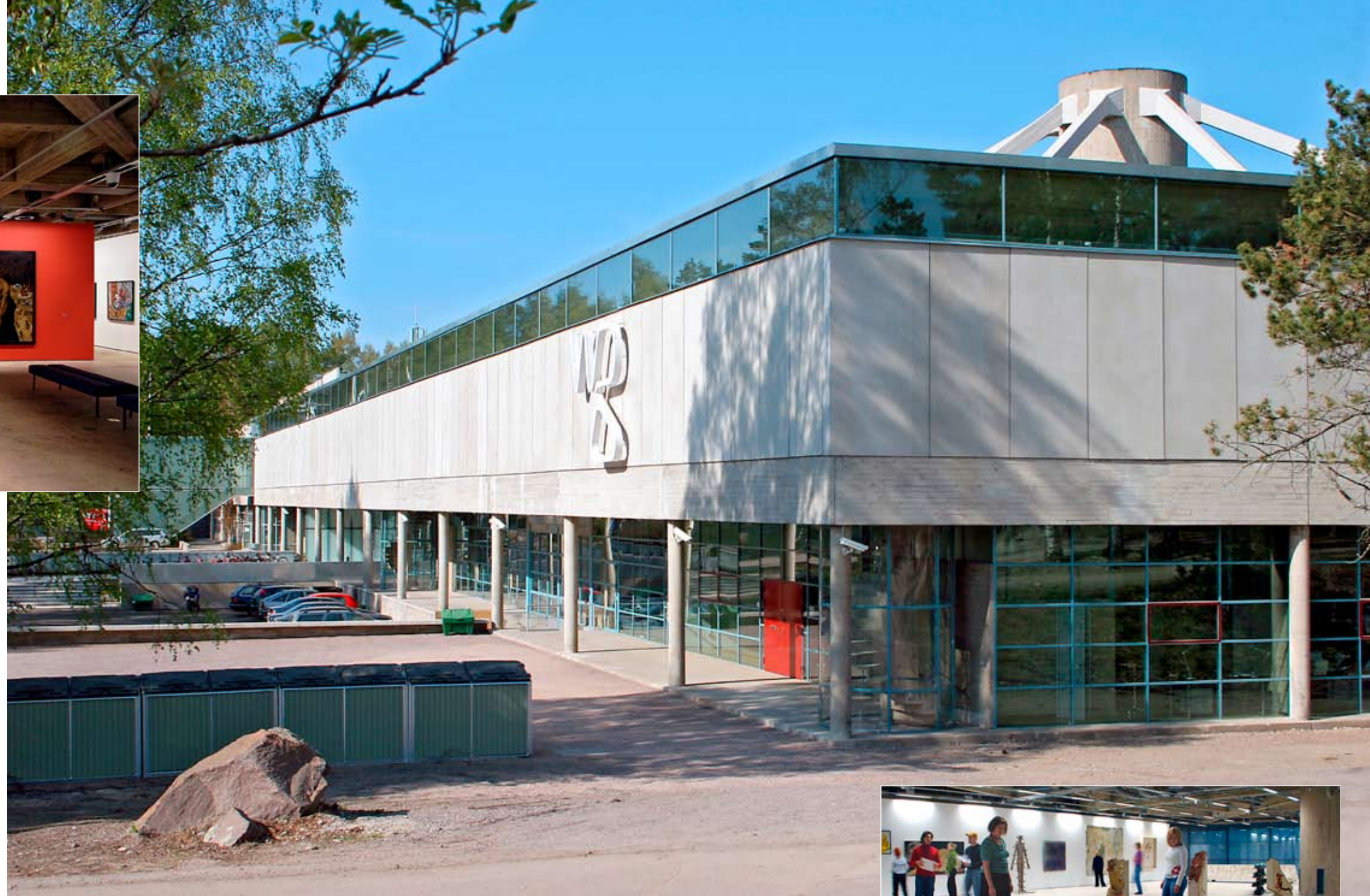
Espoo WeeGee keskus.