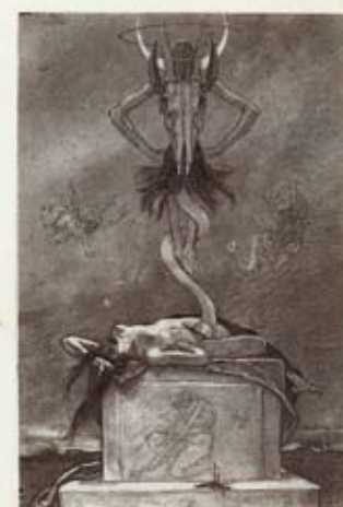
Félicien Rops. Ohverdus. 1882. F. Ropsi muuseum, Namur

Félicien Ropsi kohta pikemalt vt lk 12–13.