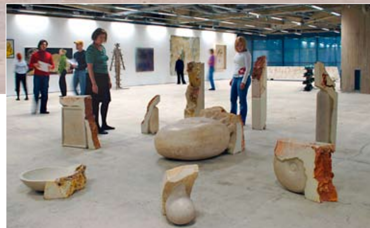
Püsiväljapanek Saastamoineni Fondi kolleksioonist.

Me soovime kindlustada oma positsiooni rahvusvahelise kunsti muuseumina. Üks selge liin on sidemete loomine ja arendamine teiste samasuguste eesmärkidega institutsioonidega. Lisaks toimivale kontseptsioonile on vaja teha väga palju igapäevast tööd, luua heade suhete võrgustik, ajastada sündmused täpselt ja omada lihtsalt natuke head õnne.