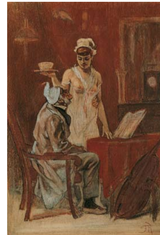
Félicien Rops. Kanapiim. 1878. Akvarell, guaaš, pastell. Félicien Ropsi muuseum, Namur

Kristlikud sümbolid toitsid samuti Ropsi erootilist kujutusvõimet. Ta pilkas pühakuid ja usklikke, eriti nende karskustõutust. Rops lõi ikonograafia, milles kasutas metafoore, tähenduste nihutamist, sõnalisi märke ja sõnamänge, tõlkides pühakute müstilisi tekste piltideks. Omal ajal põhjustas kõige suurema skandaali "Püha Antoniuse kiusa-