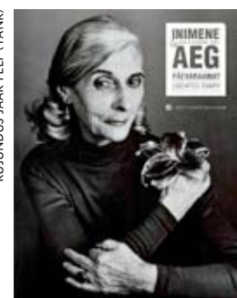
KUJUNDUS JAAK PEEP (TANK)

Tekst Véronique Carpiaux Toimetaja Tiina Abel Kujundaja Mari Kaljaste Eesti keeles, resümee inglise keeles 144 lk