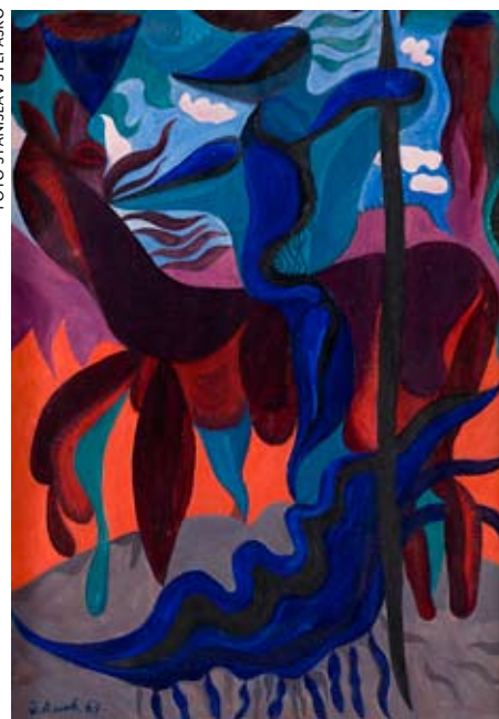
Jüri Arrak. Võitlus lohega. 1967. Õli. EKM