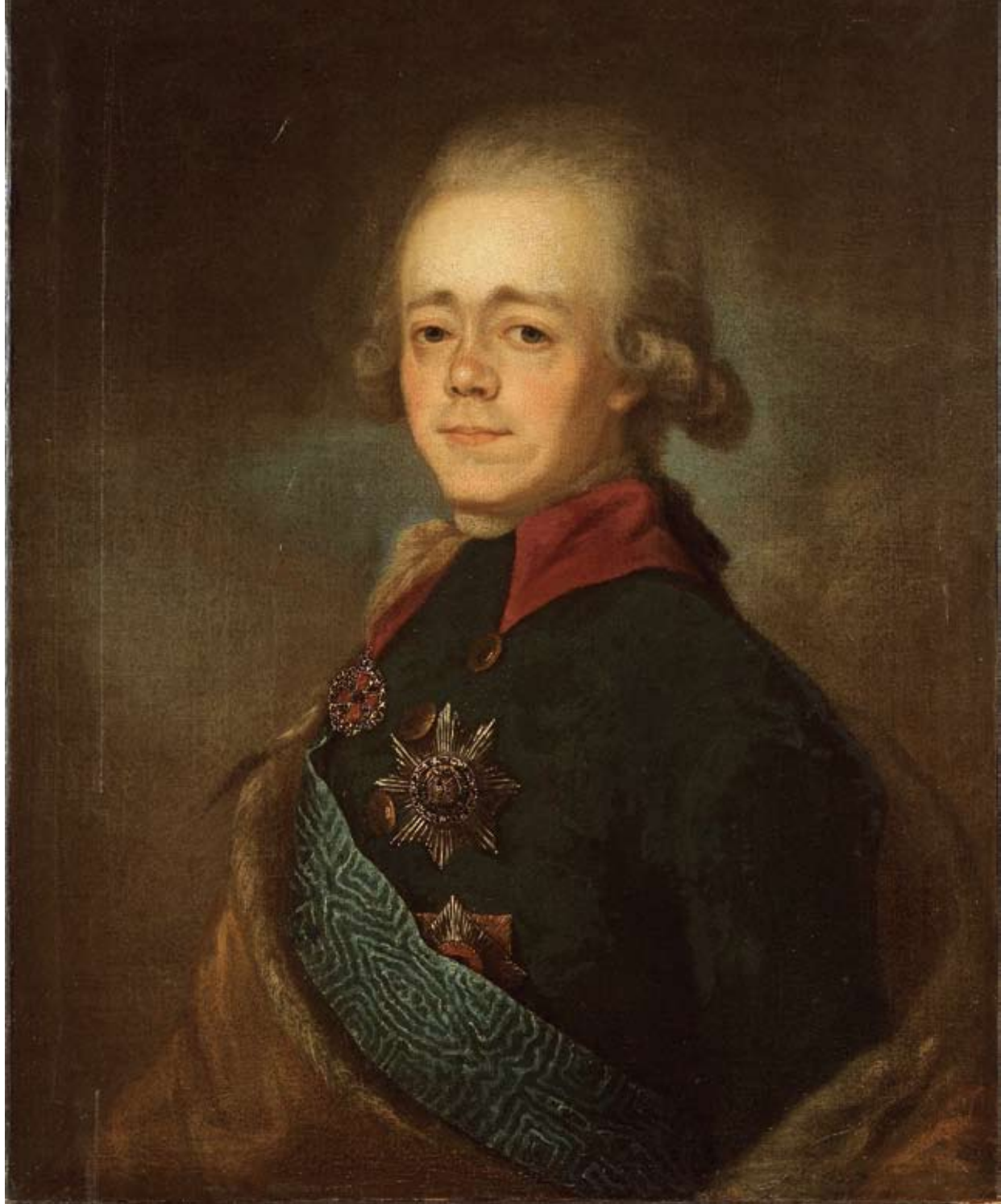
Tundmatu kunstnik Jean Louis Voille' järgi. Paul I. 1789–1797 (?). Oli. EKM