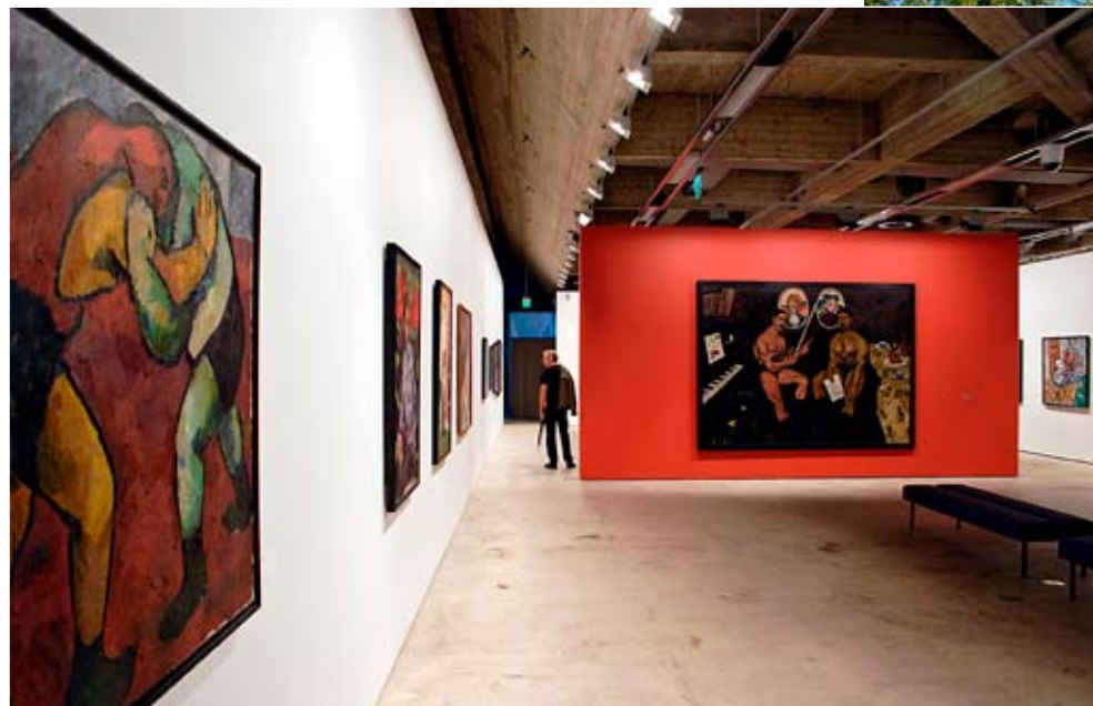
Kasimir Malevitši näitus EMMA-s.