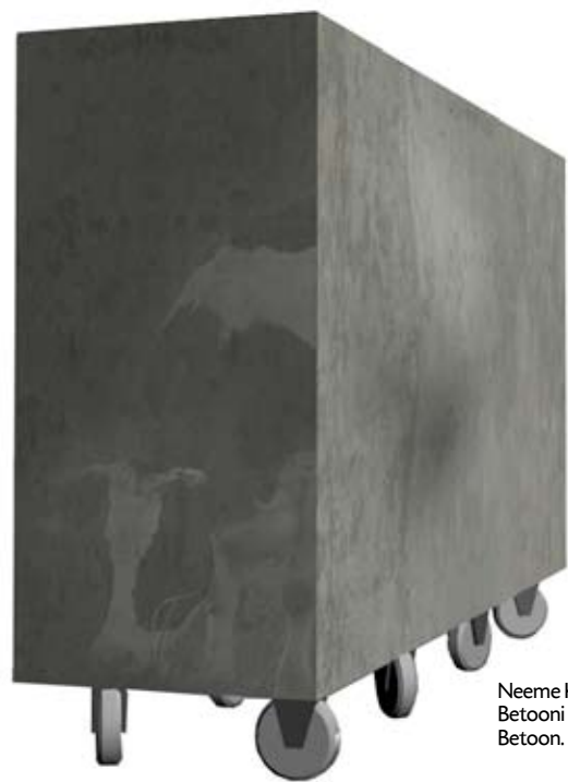
Neeme Külm. Betooni valatud lehm. 2005–2006. Betoon. EKM