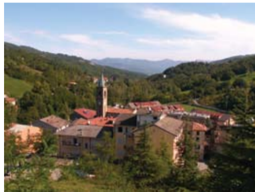
Vaade Bettola kooli aknast.

Tegusat aastalõppu soovides, Milvert Vaaks Tabasalu Palliklubi