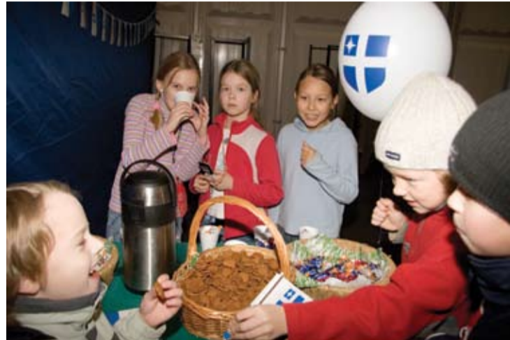
Valla vapiga õhupallide ja lipukeste kaudu oli sel aastal uuendatud Harku valla sümbolika käepäraseks tehtud ka väikestele vallaelanikele.

Laupäeval, 25. novembril kogunes Tabasalu kooli juurde püstitatud peotelki igas vanuses vallarahvast, et tähistada Harku valla taastamise 15. aastapäeva. Valla aastapäevale pühendatud üritused toimusid ka Harkujärvel, Väänas, Harkus ja Kumnas. Tabasalu Spordikompleksi korraldas perespordivõistlused ja Türisalu Spordiklubi võrkpalliturniiri.