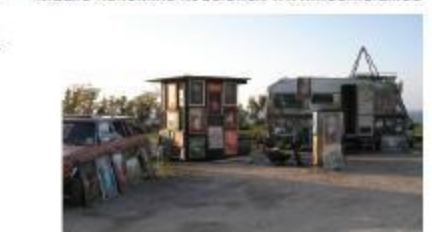
Neeme Lall Türisalu pangal