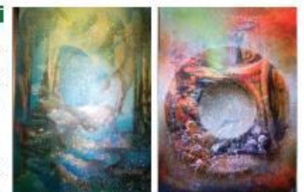
Maalid kunstniku koduühelt www.neemelall.ee