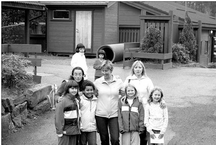
● Projektis osalejad koos kohalike lastega.