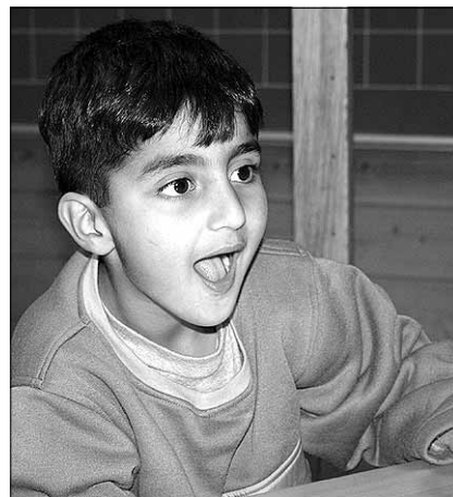
● Iraagist pärit poiss Nebrass.

Igal Norra koolilapsel on ID-kaart. Koolis antakse neile igasuguseid pile-