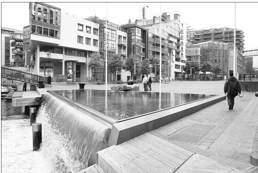
● Norra pealinna Oslo Akerbrygge linnaosa.