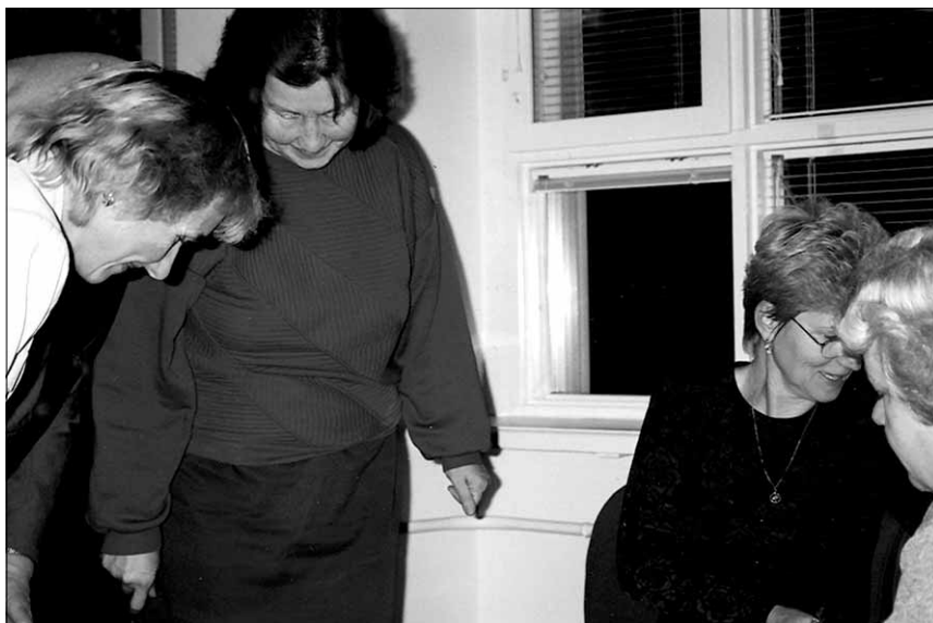
● Häältelugemiskomisjon on tegevuses.