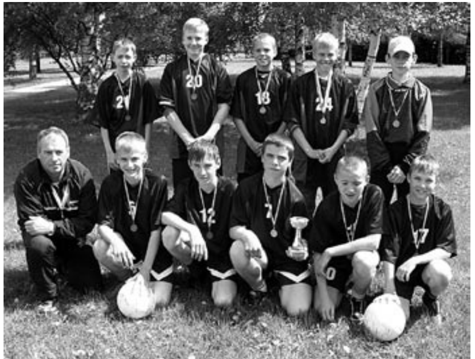
Tartumaa 2004 aasta aastalõpu saaljalgpalli turniiri võitja ja vabariikliku finaalturniiri 4 koha võitnud Puhja Gümnaasiumi võistkond: