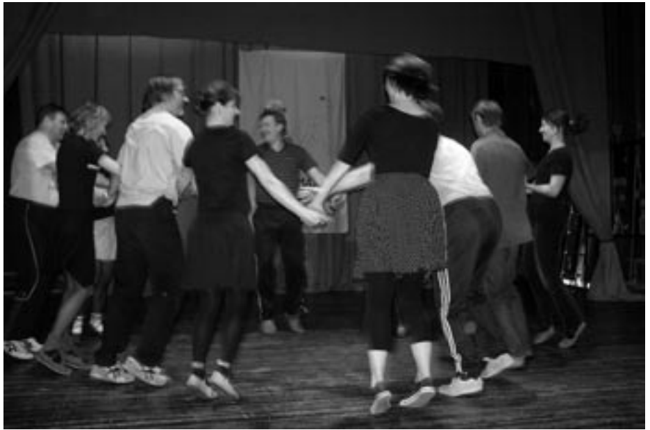
Ettevalmistus juubeli kontserdiks käib täie hooga.

Ootame oma peole endisi tantsijaid, tantsujuhte, sõpru ja kõiki Puhja elanikke!