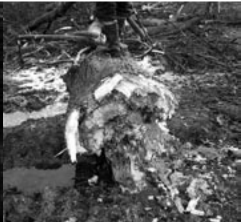
...ega vanadele, puudele