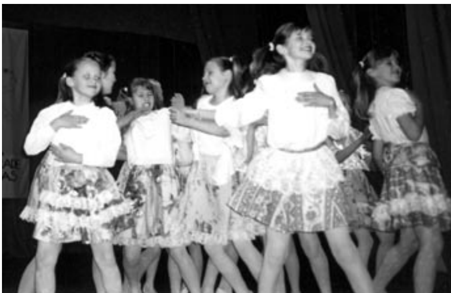
Sinilinnu nooremas rühmas tantsib 13 tüdrukut. Tants "Küll ma olen ilus!"