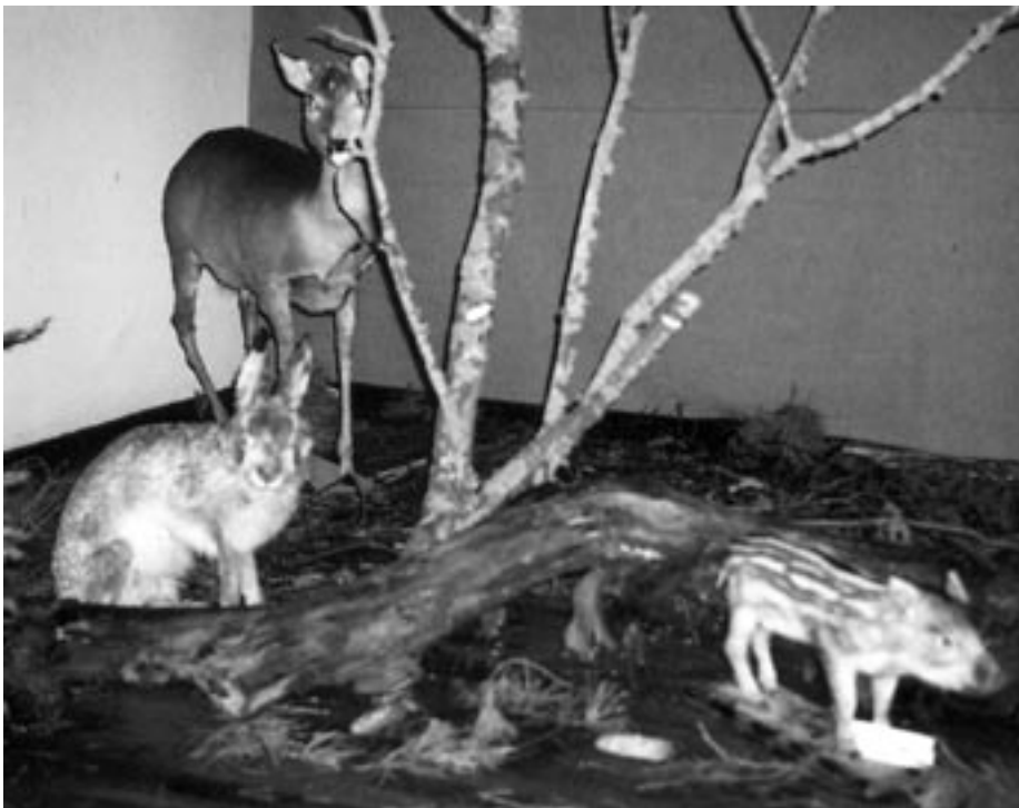
Osake eksponeeritud metsloomadest

Mõni pole mutti näinud, milline on jäneski, on meelest läinud.