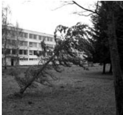
Torm ei andnud armu noortele...