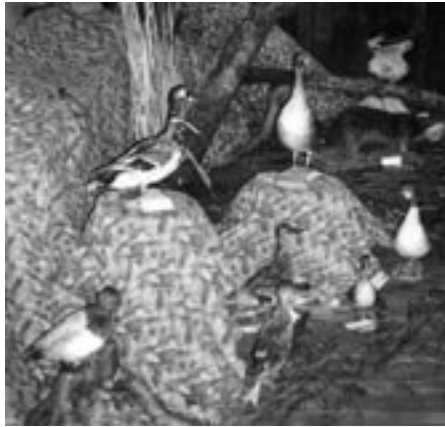
Veeloomad ja linnud

Topistele Soomaale järele viis kokulepitud päeval vaid vesine jäärada, mida mööda sõitmine (küll napilt 30-se sõidukiirusega) oli, uskuge mind, kõike muud kui meeldiv! Pühapäeval kui näitust üles panime, polnud seltsimajas voolu. Mida suudab paar küünlaleeki meie suures saalis? Läbi laussaju tuli kohale tuua kõik vajalik abimaterjal topiste eksponeerimiseks ja ilmestamiseks: puunotid, pakud, oksad, veetaimed. Kaugele polnud vaja minna. Seltsimaja ümbruses oli murtud puid ja oksa tolleks ajaks juba küllaga. Raadiost võis kuulda hirmutavat informatsiooni tormikahjustustest Viljandimaal ja et Soomaa on vee all ja võib-olla kevadeni. Kas nüüd jäävadki eksponaadid tagasi viimata?