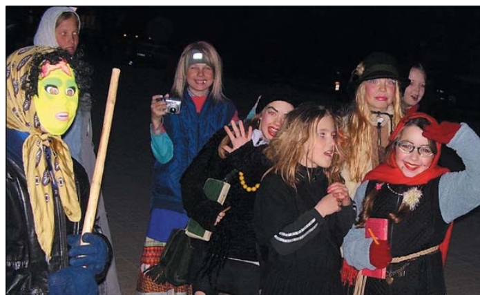
Volbriöö 2005 Jõgeva linnas möödus eelkõige lustides, mitte kurja tehes.