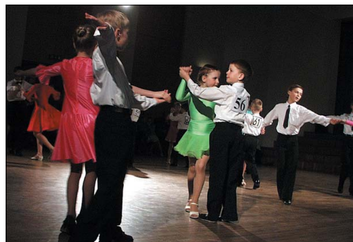
Tantsuvõistlus "Jõgeva Kevad 2005" 23. aprillil Jõgeva Kultuurikeskuses.