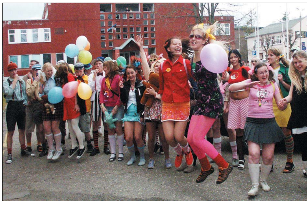
Jõgeva Gümnaasiumi tutipäevalised 29. aprillil kesklinnas.

3. maist kuni 16. maini 2005 on võimalik tutvuda kõigi tunnuslause konkursile esitatud töödega Jõgeva Linna- raamatukogus ja linna veebilehel www.jogevalv.ee Tule ja avalda oma arvamust!