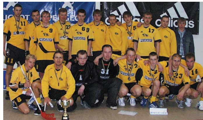
"Jõgeva Tähe" on Jõgeva linna visiitkaart. Sellel aastal toodi Eesti Meistrivõistlustelt koju teine koht.