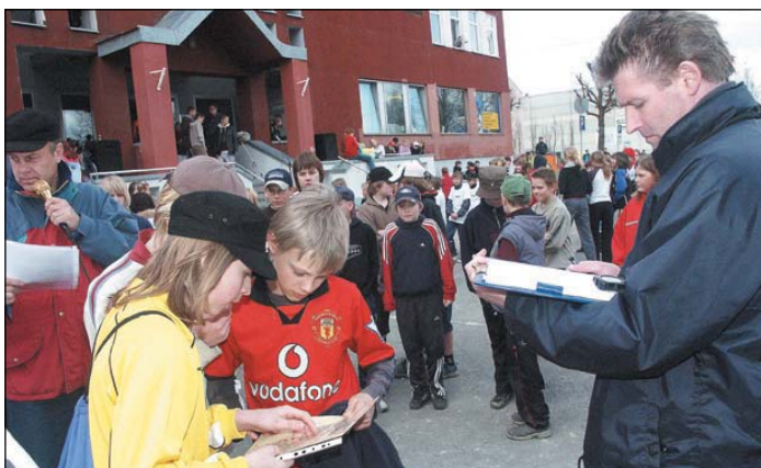
Jõgeva linna ajalooline jooks 29. aprillil kesklinnas.