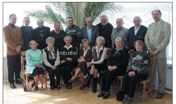
1938. aasta klubi kogunes 2. mail Jõgeva Linnaraamatukokku linna 67. sünnipäeva tähistama.