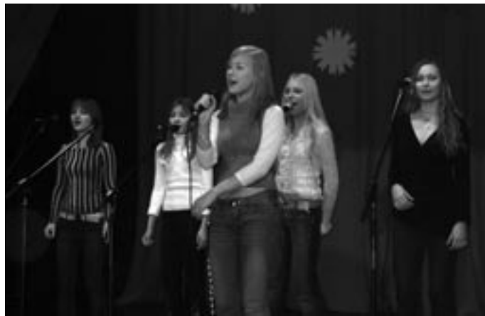
Tartu laulustuudio ansambel The Voices

tingimuseks oli vähemalt rahuldavad tulemused õppetöös ja vähemalt rahuldav käitumine. Kooli 442-st õpilasest oli kutsutud 223 õpilast. Suurest õpilaste arvust tulenevalt toimus vastuvõtt kahes osas. Kell 12:30 olid oodatud vastuvõtule 71 1.-4.klasside õpilast. Kell 13:30 toimunud vastuvõtule oli kutsutud 114 5.-9.klasside õpilast ja 38 gümnaasiumiklasside õpilast. Mõlemad üritused toimusid ühesuguse päevakava järgi. Vastuvõtu alguses tervitasid kohal tulnud vallavanem Vahur Jaakma ja volikogu esimees ning gümnaasiumi