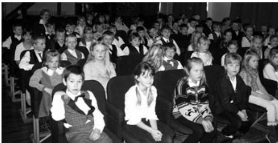
Vastuvõtul viibivad 1.-4. klassi õpilased.

23. veebruaril toimus Puhja Seltsimajas traditsiooniline vallavanema vastuvõtt tublimatele Puhja Gümnaasiumi õppuritele, sportlastele ja õpilasaktiividele. Igal aastal toimub see üritus enne Eesti Vabariigi aastapäeva. Kutse saamise kriteeriumiks oli neljad-viied selle õppeaasta klassitunnistusel või edukas kooli esindamine spordivõistlustel või aktiivne osalemine õpilasorganisatsiooni töös. Kahe viimase kriteeriumi lisa-