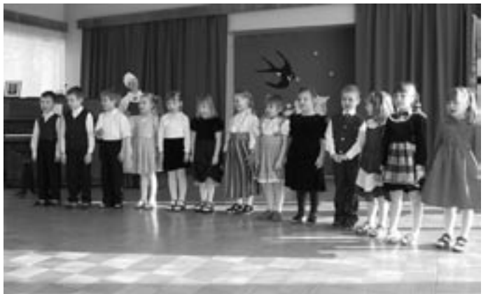
"Hoidkem Eestimaad!" Kõlab 5-6 aastaste laste laul!