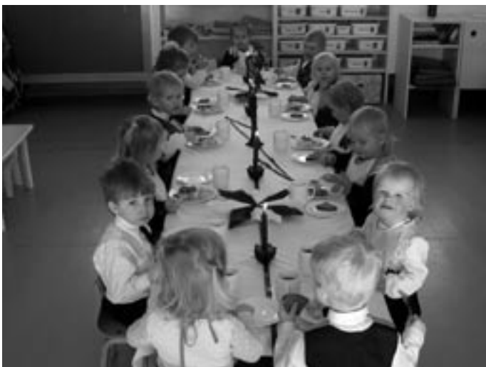
Lasteaia pesamunad pidulikku lõunat söömas Fotode autorid: Triin Pall ja Karita Kirbits