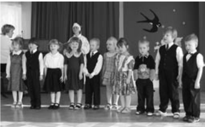
Suitsupääsukesest, meie rahvuslennust, laulavad 4-5 aastased tüdrukud-poisid