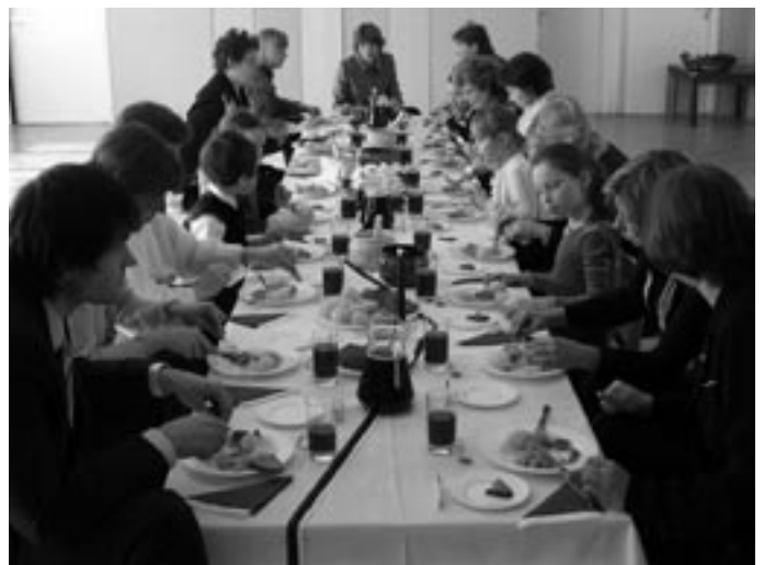
Saali kaetud peolauas söid lõunat vanema rühma lapsed koos õpetajate, maja teiste töötajate ning külalistega