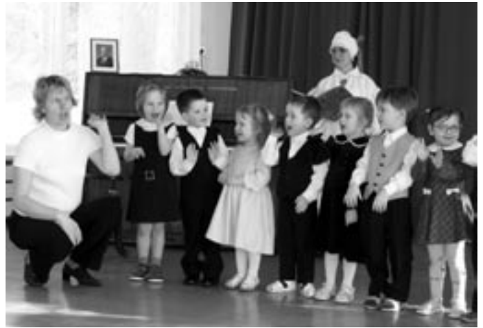
"Pääväk tule välla..." esinevad 3-4 aastased lapsed