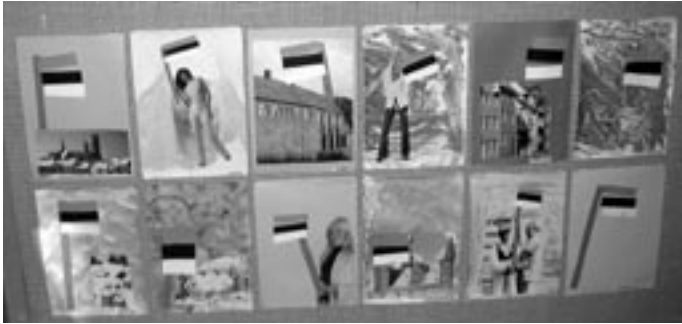
Sõimerühma lapsed õppisid selgeks lipu värvid ja tegid koos õpetajate Urve, Olga ja Ingridiga toreda kleepetöö "Eesti lipp"