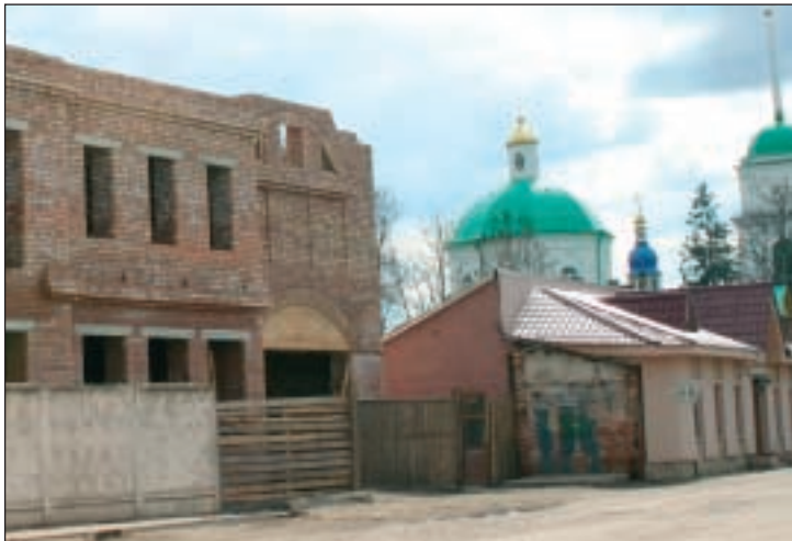
Petseri kesklinnas tegi ehitustöödele ukse lahti klooster oma tulevase külalistemajaga.

mistul heakorratöid ning osaleda Seto Kuningriigi päeval Luhamaal. (...) Tagasiteel käisime Mõla järve ääres ja kalmistul ning esmakordselt külastasime Pihkva järve ääres asuvat vene uusrikaste suvilate rajooni Krivskit, kus kõrvuti on rikkus ja vaesus. Öhtuks jõudsime Petseri hotelli ööbima. Järgmisel päeval külastasime kloostrit ning Petseri II